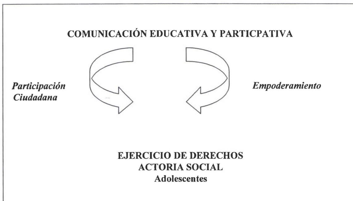
Gráfico No 1 Relaciones entre Comunicación , Participación Ciudadana y Empoderamiento