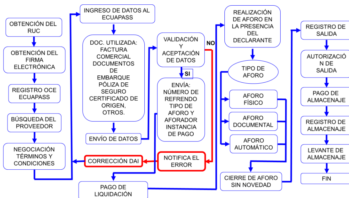
Figura 16. Flujo del proceso de importación