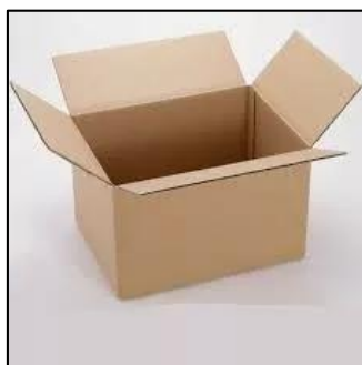
Figura 10. Caja de cartón Corrugado 60x40x40 Reforzada

Es el acondicionador, presentador, manipulador, para almacenar y transportar el producto por medio del embalaje la cual tiene tres requisitos fundamentales que son: resistencia, protección y conservación el producto (impermeabilización, higiénico, adherencia, etc.). (QuimiNet, 2006)