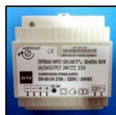
Figura 4. Alimentador Power Supply

Por último, tenemos al Alimentado Power Supply de carril DIN o directo a la pared, protegido con fusible electrónico contra sobrecargas y cortocircuitos, fabricado con plástico ABS, material auto extingible y la posibilidad de diferentes tensiones de entrada.