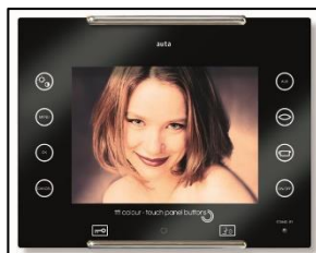
Figura 2. Monitor Avant Digital

La primera parte contiene un monitor de manos libres con pantalla a color de 5.6” que se instala en un sitio accesible dentro del domicilio que permite visualizar la imagen de la visita, también consta con un micrófono que permite brindar una comunicación nítida entre las personas.