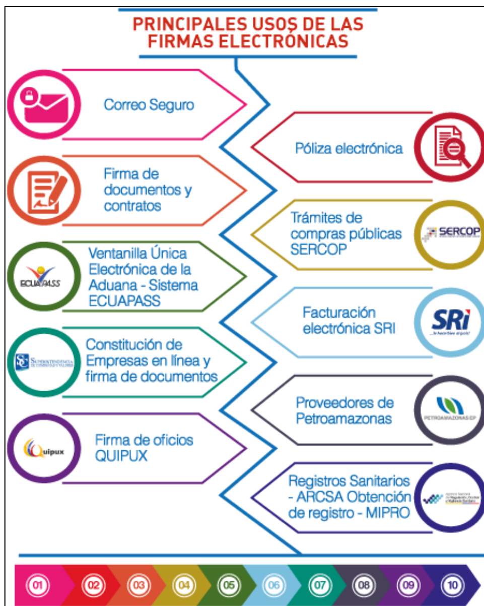
Figura 17. ¿En qué puedo usar la Firma Electrónica?