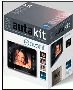
Figura 9. Kit Video Digital S1 Kvd-1 Avant Coaxial