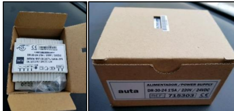
Figuras 7 y 8. Envase

Es la primera envoltura que protege al producto en el cual lo mantiene en conservación, asegurando que se mantenga en un buen estado el producto, ayudando a facilitar su transporte. (QuimiNet, 2006)