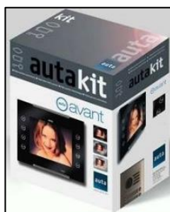
Figura 1. Kit Video Digital S1 Kvd-1 Avant Coaxial

El kit está constituido por dos partes fundamentales: interiormente se refiere al monitor instalado dentro del domicilio y exteriormente se encuentra instalada la placa de calle.