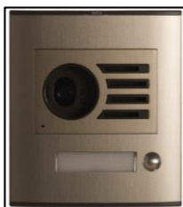
Figura 3. Pc Digital Fv S1

climatológicas que se den en el sector que se encuentra el domicilio. Cuenta con el botón de timbre que pone alerta al usuario que tiene visita, por otro lado, contiene una micro cámara a color con la que permite visualizar la imagen de la visita y por último tiene un micrófono el mismo que permite una comunicación ideal por medio de la reproducción de voz tanto interna como externa del domicilio entre las personas.