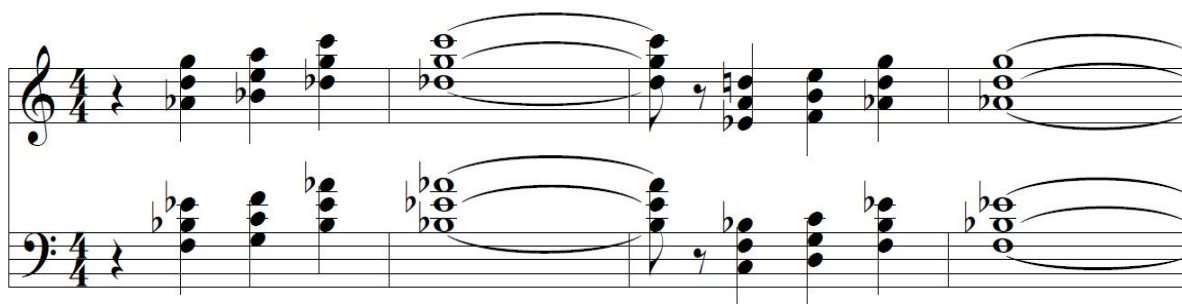
Figura 3: Los primeros cuatro compases de la música incidental para la obra de teatro de Joséphin Péladan, Les files des étoiles , por Erik Satie.

A continuación, se presentan ejemplos del uso de voicings , compuestos por intervalos de cuartas en lugar de terceras, dentro de la música correspondiente al impresionismo.