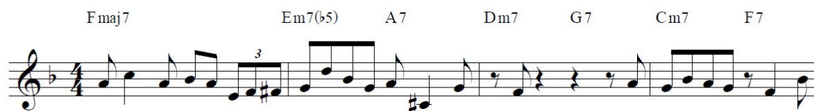
Figura 1: Confirmation , por Charlie Parker, un estándar del bebop .

Al finalizar la Segunda Guerra Mundial en 1945, el ambiente social en los Estados Unidos estaba cargado de fuerte discriminación y segregación racial. Esto, naturalmente, provocó resentimiento en los músicos negros que, junto a la necesidad de un cambio musical, indujo en el jazz el desarrollo del bebop (Santillana Educación, 2006, p. 134), que buscaba alejarse de la escena del espectáculo y el entretenimiento. Desde 1940, encabezados por el saxofonista Charlie Parker, el trompetista Dizzy Gillespie y el pianista Thelonious Monk, los músicos de jazz interpretan en grupos pequeños (cuartetos o quintetos) versiones de canciones populares de gran invención y destreza técnica (Hennessey, 1994, p. 149).