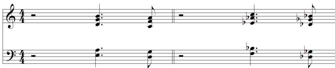
Figura 5: Voicings “So What”, por el pianista Bill Evans, en el tema del mismo nombre.

En este contexto el voicing utilizado representa primero un acorde de Em7 con una cuarta como tensión, que resuelve en el upbeat del cuarto tiempo a un acorde de Dm7 en exactamente el mismo voicing . La misma figura se repite sobre Ebm7, es decir, medio tono encima del motivo original, lo que genera una sensación de movimiento dentro de una armonía estática (Barret, 2006, p. 195).