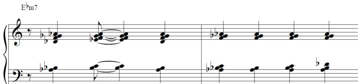
Figura 10: Ídem (min. 7:31).

En este fragmento se puede notar que la línea principal se mueve dentro del voicing , y que la frase adquiere un carácter rítmico. Así, estos voicings pueden entenderse fuera de un marco tonal, y como simples representaciones del modo (Eb dórico) en que se tocan y su sonoridad general.