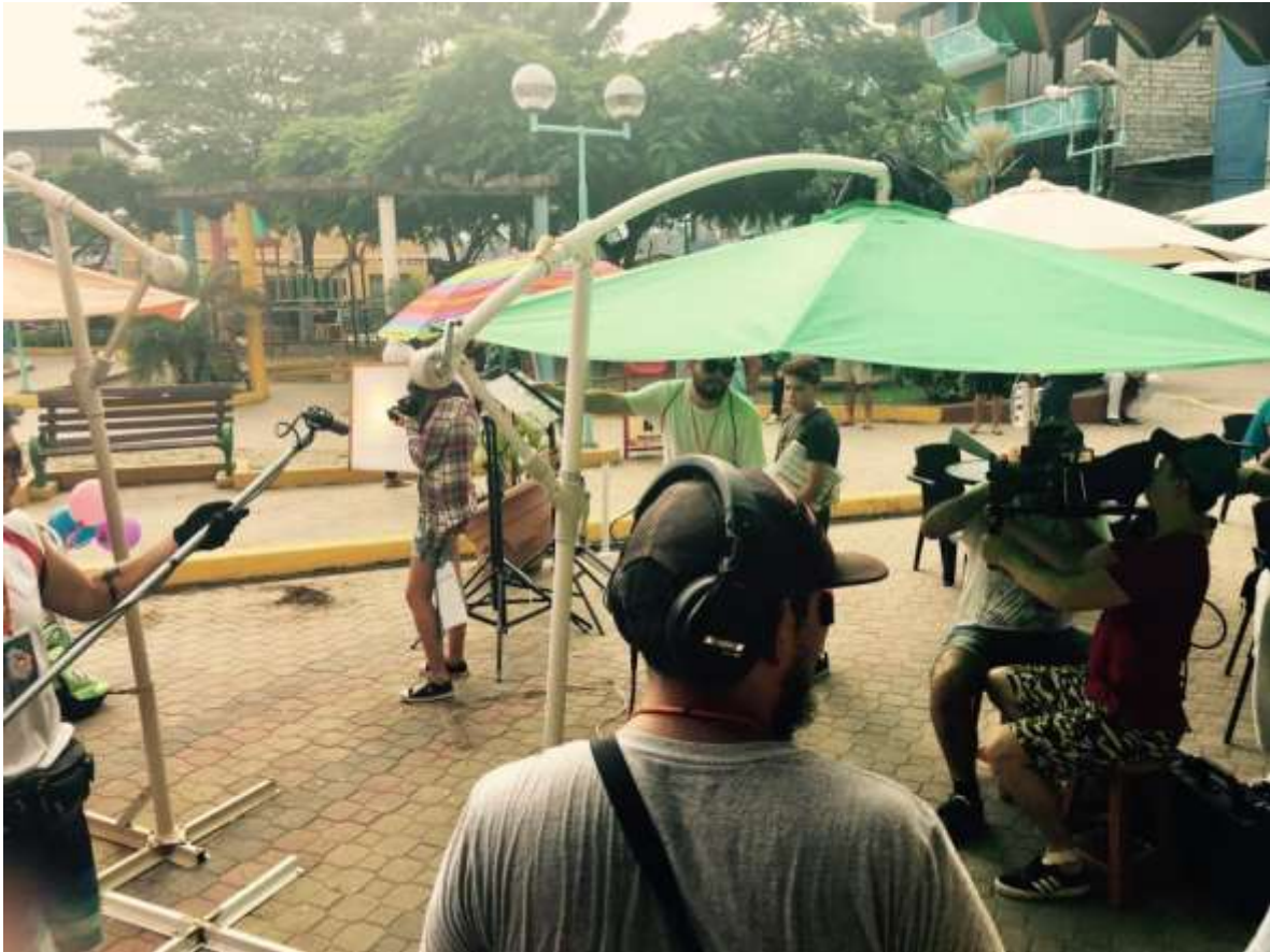
Figura 1. Primera escena del primer día de rodaje en esmeraldas.

En la tercera etapa en conjunto con el director, se sincronizará todos los archivos de audio con todos los archivos de video para que se inicie la etapa de edición, en paralelo se formará una biblioteca de sonidos preparándonos para la postproducción, en los cuales se incluirá foleys y wild tracks que no se hayan registrado durante el rodaje y la selección de la música a utilizarse.