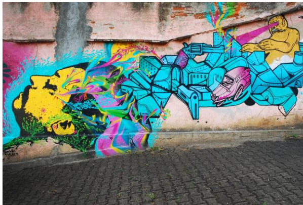
Figura 1. Mural, Los APC

La palabra italiana graffiti viene del griego grapho (escribir, dibujar, resaltar), se empieza a utilizar a fines de la década de 1970 para nombrar la actividad furtiva y callejera de pintar y rayar en el entorno urbano con pintura de aerosol.