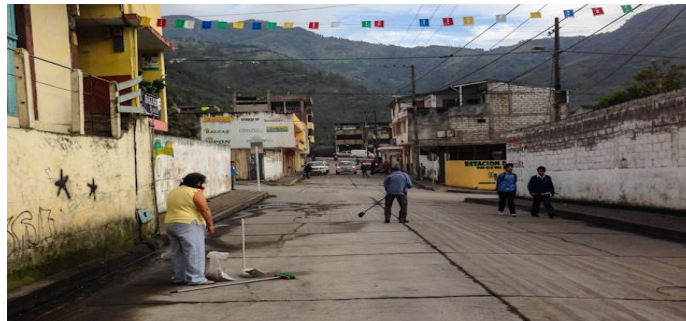
Figura 5. Escenario Baños.

La idea básica del escenario es mostrar distintas atmósferas en la grabación, para lo cual se usarán distintas tomas en varios lugares tanto desde el inicio del vídeo como hasta el final. Aparte en la entrevista en off se grabará en distintos lugares que previamente serán escogidos para grabar y encuestar al artista. Se manejaran distintos lugares según el tipo de ambiente que se disponga al momento, para analizar por parte como mejorarían al exponer el arte del artista PIN 8 y que sean adecuadas al vídeo a realizarse.