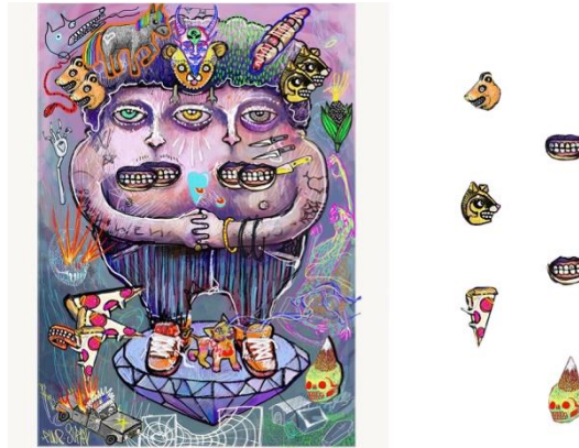
Figura 2. Boceto espejo.

Tomado de Instagram, (Andrés López) PIN 8, 2016.