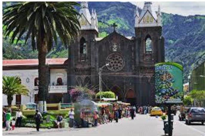
Figura 6. Colorización

El color que se va a utilizar al principio de la grabación serán colores propios del lugar.