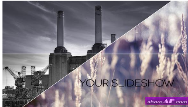
Figura 4. Slideshow

Tomado de la página Abstract Slideshow, Bookmarks, 2014.