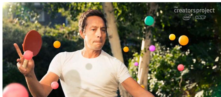
Figura 3. Parallax

Asimismo, al editar partes del vídeo, se realizará varias técnicas que se usa en After Effects, llamada (Slide show, Parallax), que consiste en emplear diferentes trazos o figuras, frame por frame, lo cual al emplear el easy to easy se generará que se reproduzca con más suavidad y al ejecutar el vídeo se visualizará distintos efectos.