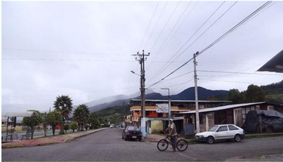
Figura 9. Baeza.

Finalmente se llega a Cosanga, que está ubicada en la Provincia amazónica de Napo y pertenece al Cantón Quijos, lugar por donde pasa el oleoducto que transporta petróleo en la región. La parroquia cuenta con el Río Cosanga, el cual la atraviesa de norte a sur, al oeste del mismo tenemos la Quebrada Logmaplaya, Quebrada Yanayacu Chico, Río Yanayacu Grande, Quebrada Pumayacu y Río Aliso. Hacia el lado este del Río Cosanga contamos con el río Arenillas, Quebrada Guachamín, Río Chontas Chico, Río Chontas Grande y Río Llushcayacu.