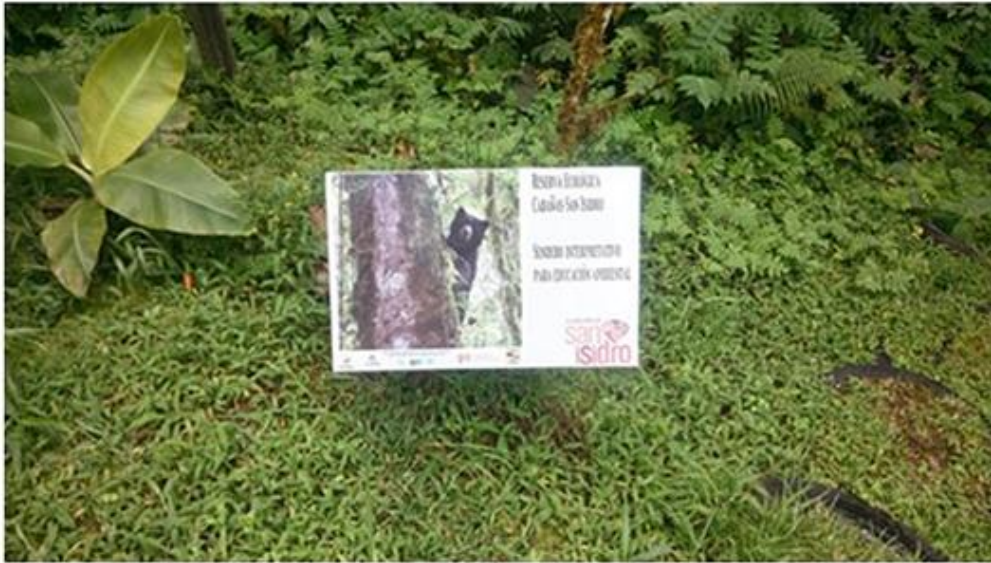
Figura 28. Letrero indicativo en Sendero Interpretativo en Cabañas San Isidro.