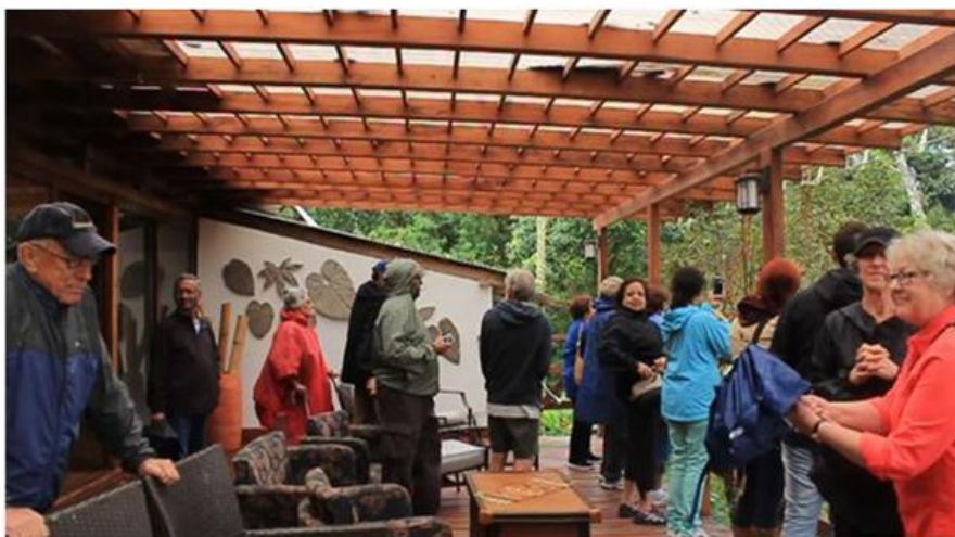
Figura 2. Grupo de avituristas en el mirador de Cabañas San Isidro.