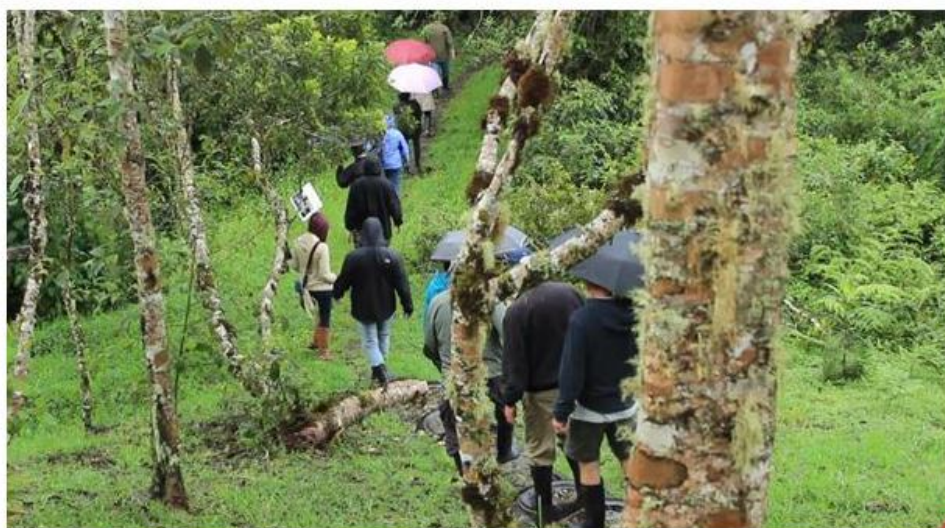
Figura 1. Recorrido de avituristas por los senderos de avistamiento de aves.

El documental es de gran importancia conociendo la riqueza que poseemos y la cantidad de turistas a nivel mundial que se interesan en esta actividad del aviturismo. Su divulgación a través de internet, llegaría a mucha gente no solo a nivel nacional sino a nivel internacional, no es lo mismo que la gente busque información escrita en libros de lugares donde puede observar aves, que en algo tan dinámico como es la muestra audio visual.