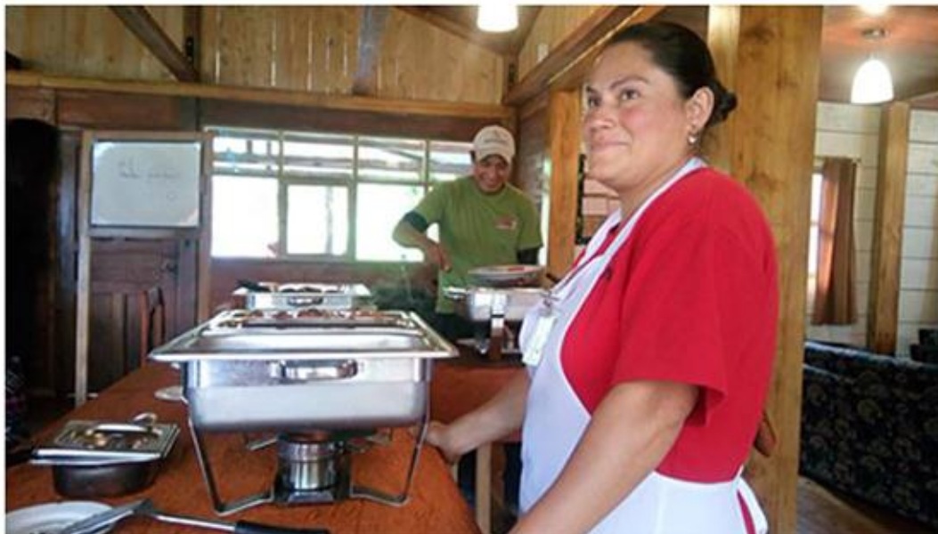
Figura 30. Habitante de Cosanga que labora en cocina-Cabañas San Isidro.