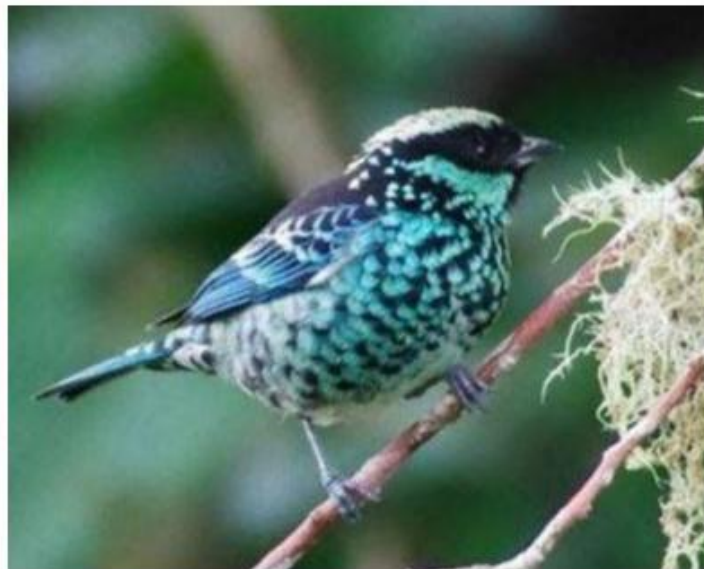
Figura 15. Tangara Lentejuellada (Tangara Nigroviridis)