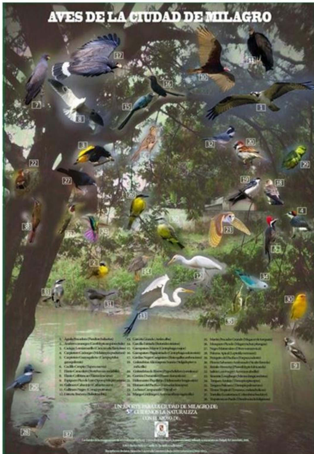
Figura 26. Afiche de aves elaborado para la Ciudad de Milagro-Ecuador.

Facebook CUIDEMOS LA NATURALEZA al igual que las Cabañas San Isidro, ayudará con la promoción de ésta página.