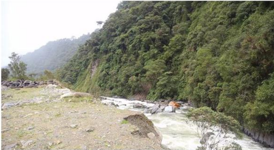
Figura 6. La Ruta de Aviturismo Oriental brinda acceso a bosques de la ladera oriental de los Andes.

La vía mencionada ofrece facilidad para observar aves, así como también disponibilidad de hospedaje y gente con conocimientos sobre aviturismo.