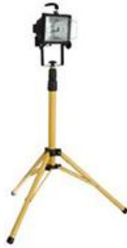
Figura 24. Reflector halógeno.