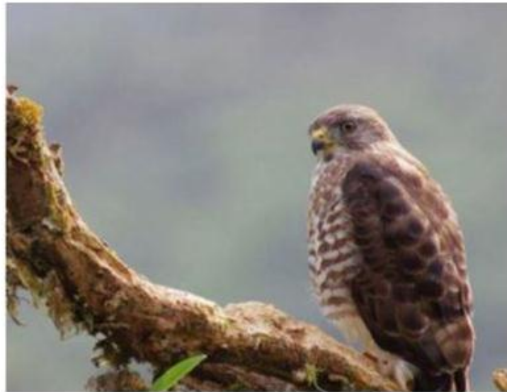
Figura 16. Gavilán Aludo (Buteo Platypterus)