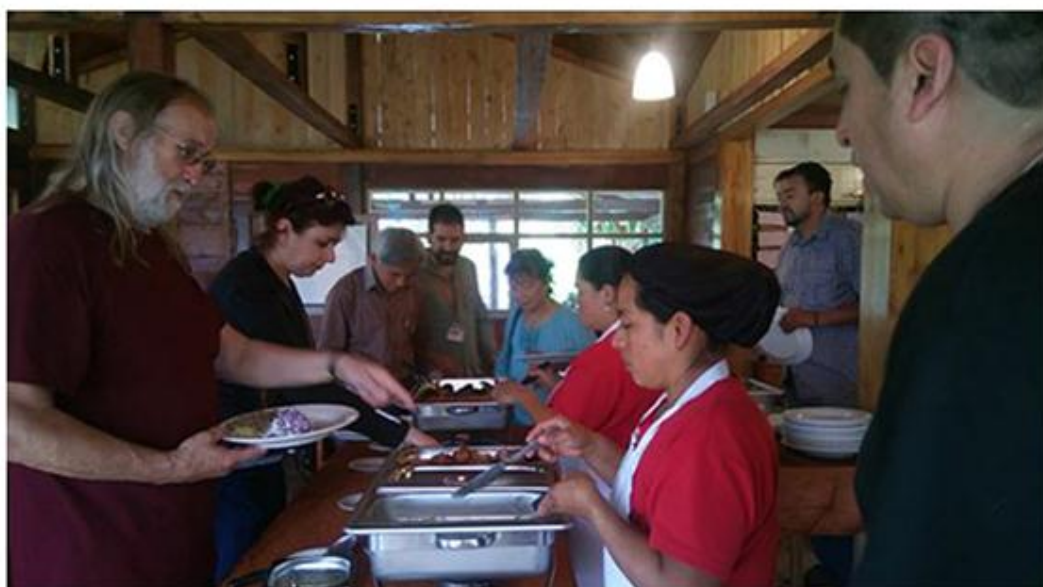
Figura 33. Restaurante de San Isidro atendido por personas de Cosanga.

La actividad del turismo mismo en progreso genera más ingresos para el proyecto y requerimientos de personas para que realicen determinada labor, es así como se genera ingresos para estas personas por servicios temporales de guías naturalistas, ayudantes de cocina, jardinería, mantenimiento de senderos, transporte para turistas y también para abastecimientos de materiales para la ejecución de proyectos especiales, como por ejemplo la construcción de una laguna artificial.