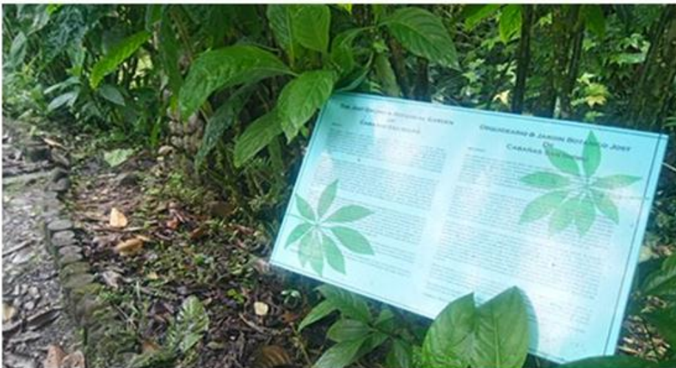
Figura 29. Letrero indicativo sobre plantas en Sendero Interpretativo en Cabañas San Isidro.