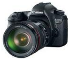
Figura 21. Cámara 6D

-Como se nombra anteriormente, las situaciones climáticas son muy extremas, en el lugar siempre hay lluvia, muchas veces polvo, por lo tanto este lente tiene resistencia a humedad y al polvo.