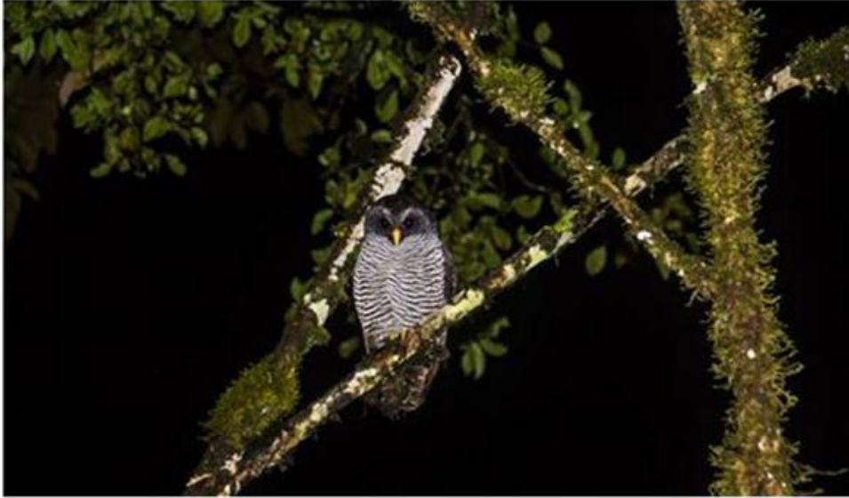
Figura 14. Búho de San Isidro ("Ciccaba??")

Esta reserva ha inventariado más de 300 especies, lo que la convierte en destino para los observadores amantes de las aves.