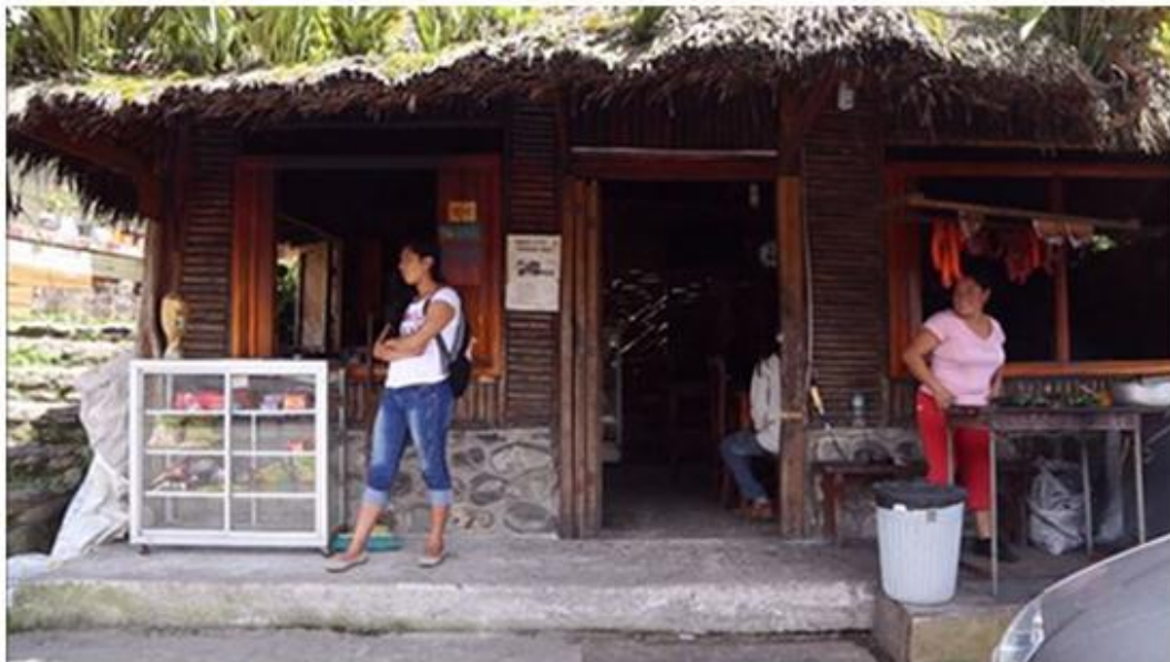
Figura 31. Paradero en el pueblo de Cosanga.

Todas estas enseñanzas orientan a los pobladores a proyectarse a otras formas de comercio que genera este tipo de actividades, diferentes a las que habitualmente hacían y perjudicaban el medio ambiente, es así como sus habitantes han comenzado a establecer sitios de alojamiento y restaurantes en los que expenden platos típicos de la zona, aplicando los conocimientos aprendidos y proyectándose a aprovechar el turismo.