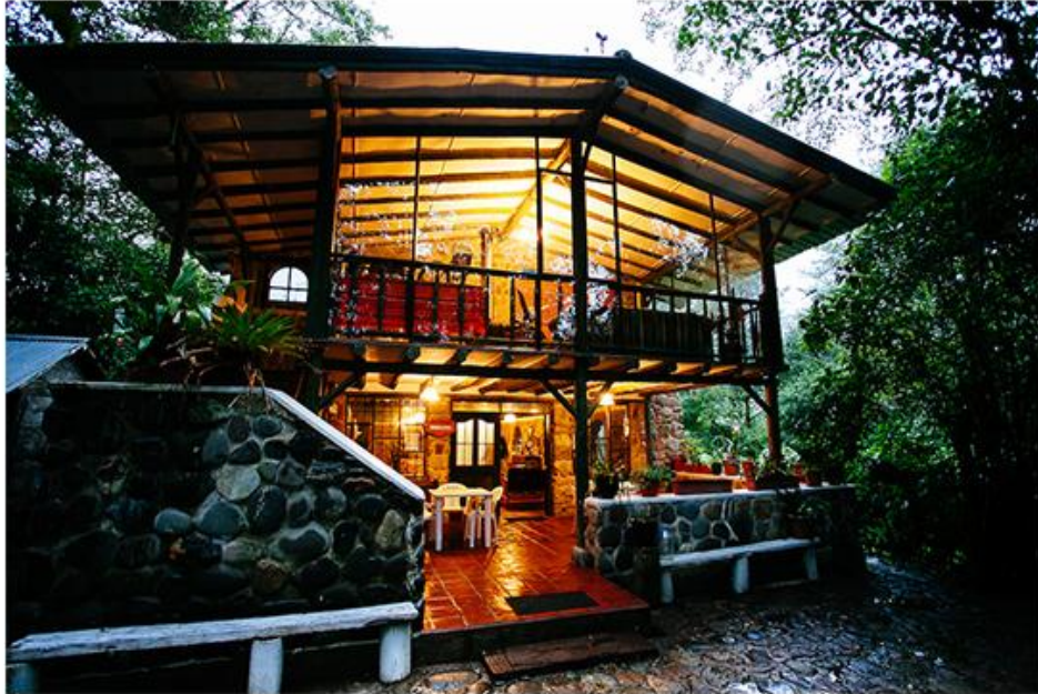
Figura 8. Guango Lodge, tiene los mejores bebederos para colibríes.

Se llega luego a Guango Lodge que protege un área de bosque templado y tiene los mejores bebederos para colibríes.