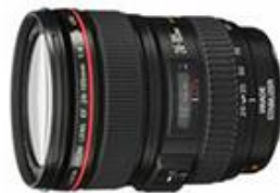
Figura 22. Lente 24-105mm.