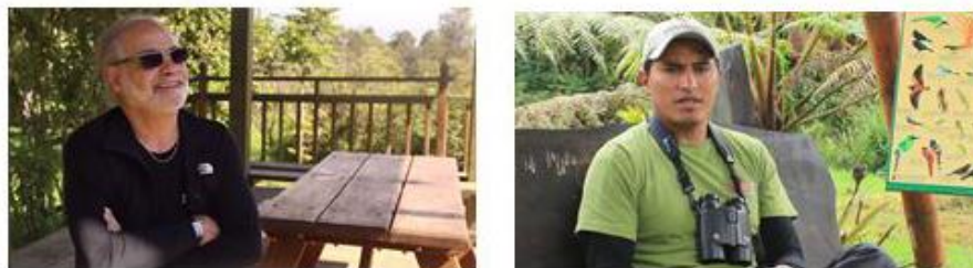
Figura 18. Plano medio.

Los planos medios ayudan mucho para poder apreciar al personaje en cuanto a sus expresiones, nos permite enfocarnos mucho más en las acciones del personaje relacionándolo con su entorno mismo, dándole un valor narrativo. Esto se lo utilizará en las entrevistas y para la gente que trabaja en las Cabañas San Isidro.