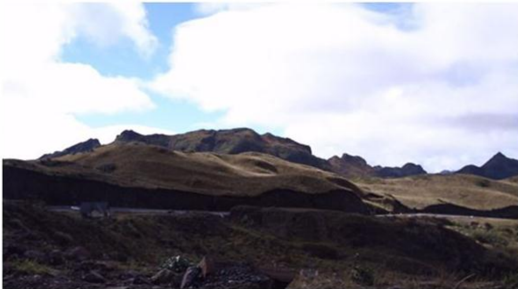
Figura 5. La Ruta de Aviturismo Nororiental ofrece acceso al Páramo Andino.

El documental como relato informativo, describe situaciones varias, como es el caso por ejemplo del recorrido por la vía interoceánica Pifo-Papallacta- Baeza, que coincide con la Ecoruta Nororiental y nos permite apreciar el acceso directo al páramo andino y bosques de la ladera oriental de los Andes hasta llegar a la Amazonía, utilizando una narrativa que coincide con la descripción de los escenarios que aparecen en el recorrido hasta llegar a Cosanga.