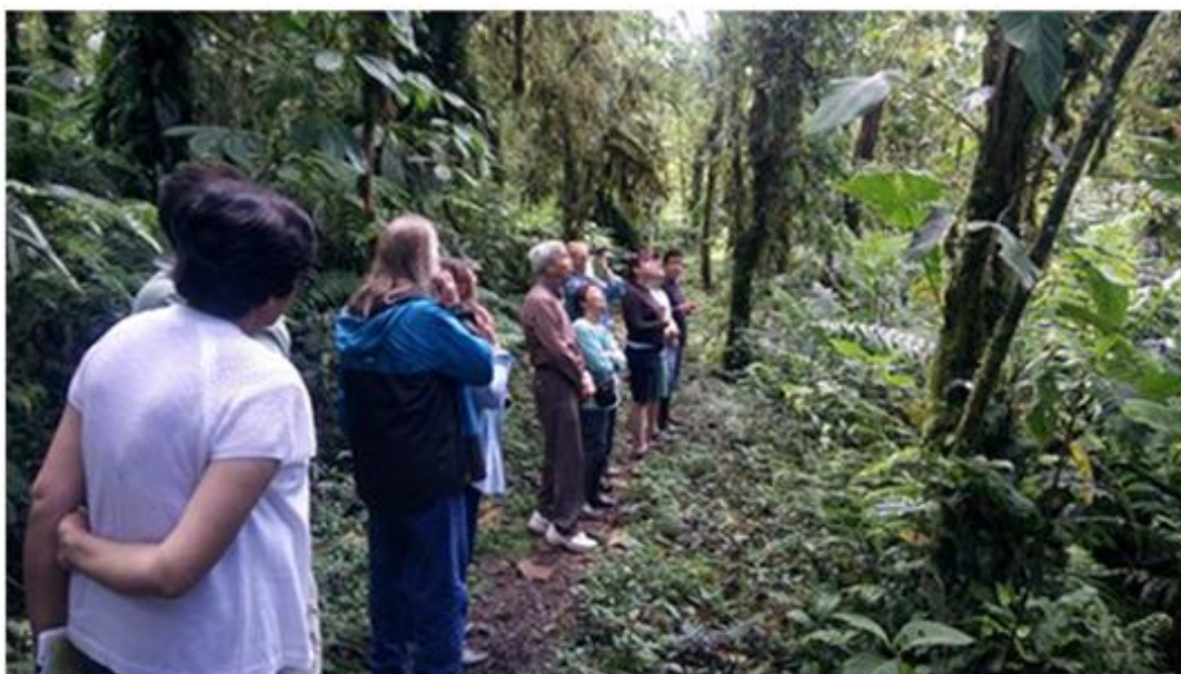
Figura 32. El corredor ecológico constituye un gran atractivo turístico para la observación de aves.

El flujo de turistas alcanza a más de 2.500 turistas/noche/ al año, con tendencia a crecimiento. El corredor ecológico, se constituye en un gran atractivo turístico, así la empresa ha tomado nuevas estrategias especialmente en ventas para atraer turistas no solamente en el campo de observación de aves, sino en muchos otros campos que el sitio puede ofrecer. Se la está promocionando internacionalmente con el apoyo de la USAID (Agencia de los Estados Unidos para el Desarrollo Internacional), en ferias, shows, páginas web, folletería, este aumento de flujo de turistas repercute en la demanda de productos alimenticios, artesanías y mano de obra directa e indirecta.