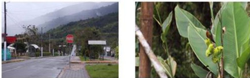
Figura 17. Plano general

Con la utilización de este plano se intenta presentar el universo espacial en donde se desarrolla la temática del documental y así mismo dar un sentido de ubicación, resaltando principalmente las características del entorno, como la flora y fauna del lugar.