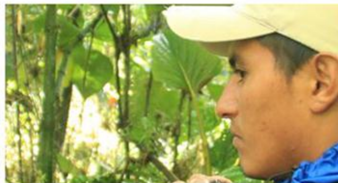
Figura 20. Primer plano.

Este plano ayuda a resaltar las expresiones de los personajes aportando más expresividad al trabajo audiovisual.