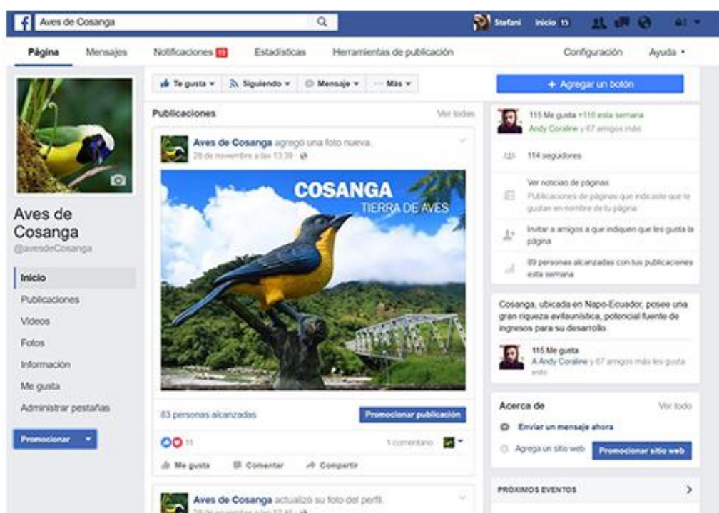
Figura 27. Fan page "Aves de Cosanga"