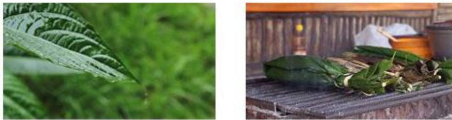
Figura 19. Plano detalle.

Este plano ayuda mucho para resaltar los detalles en cuanto a la diversidad en flora, fauna, gastronomía. Además le da un valor muy significativo y un valor descriptivo al contexto en sí del documental con el fin de resaltar la belleza de los elementos que se desea presentar.