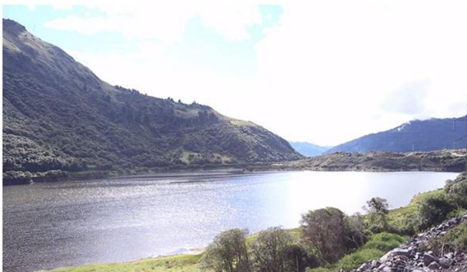
Figura 7. Laguna de Papallacta.

A lo largo del camino, se pueden divisar importantísimas reservas ecológicas como la del Antisana de 120.000 hectáreas y el páramo andino; se llega al sector de Papallacta, en donde se encuentra la laguna y el Resort Termas de Papallacta, conocido por sus aguas termales.