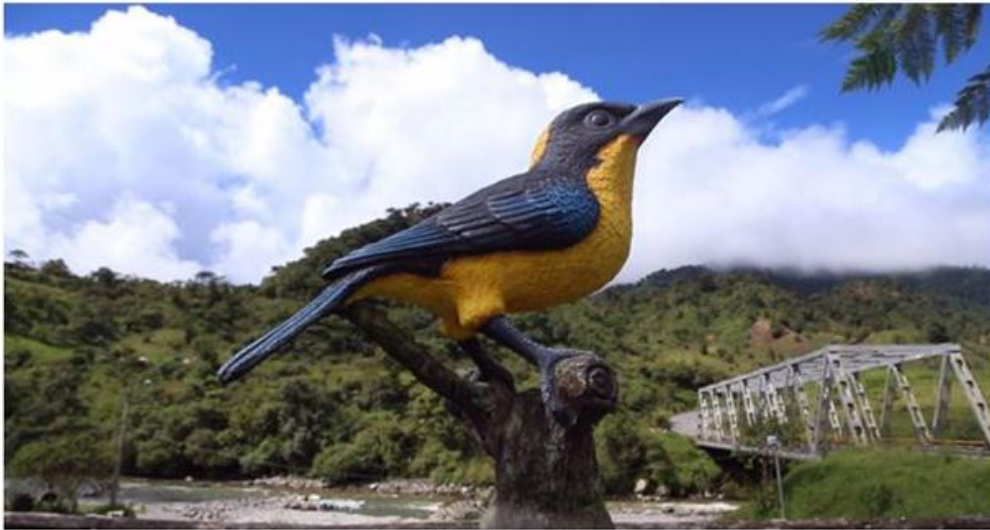
Figura 10. Monumento al ave en el pueblo de Cosanga.

El clima de Cosanga es “Tropical megatérmico húmedo”, con una precipitación media anual que oscila entre 1100 milímetros y sobrepasa los 3500 mm. Las épocas de más lluvia están en junio y febrero y condiciones secas son de agosto a noviembre y muchas veces enero.