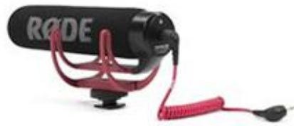
Figura 25. Micrófono RODE.