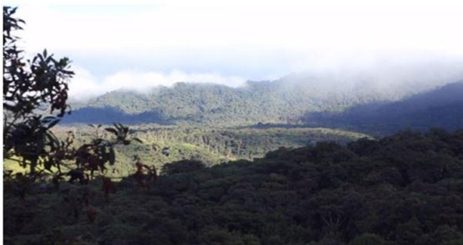
Figura 4. Reserva Ecológica Antisana.

Se debe anotar como dato adicional que el SNAP (Sistema Nacional de Áreas Protegidas) trabaja a nivel de las cuatro regiones del país y alberga 51 reservas naturales, entre parques, reservas, refugios, áreas nacionales de recreación, que equivalen aproximadamente al 20% del territorio nacional. Con el aumento de la preocupación por conservar y proteger la naturaleza que ha surgido en los últimos años, se espera siga progresando. (Ministerio de Ambiente. (2015). Sistema Nacional de Áreas Protegidas del Ecuador- SNAP . Recuperado de http://areasprotegidas.ambiente.gob.ec/info-snap ).