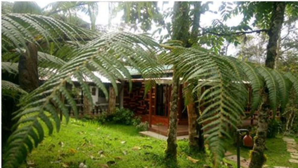
Figura 12. Parte posterior del mirador de Cabañas San Isidro.

Cabañas San Isidro cuenta con 12 habitaciones dobles, con capacidad de alojamiento para 24 huéspedes. Su gastronomía está considerada como una de las mejores a nivel nacional. Este lugar es pionero en aviturismo, con 27 años de trabajo y promotor de la conservación del medio ambiente. Tiene experiencia en investigación, posee mucho conocimiento de la flora, fauna, ecología e historia natural en general y cuenta con personal capacitado en áreas hoteleras y aviturismo. Su manera de operar ha sido realizada de la mejor manera, siendo verificados por Rainforest Alliance.