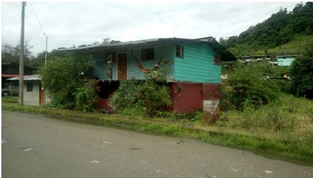
Figura 11. Casita de la población de Cosanga.

En cuanto a aves, se destacan las tangaras, gran cantidad de colibríes, pavas de monte, trogones, tucanes y un ave muy especial que es el “Búho de San Isidro”, que ha tomado este nombre por ser una especie endémica del sector de las Cabañas del mismo nombre, motivo de la presente investigación. (GadprCosanga. (2014). Plan de desarrollo y ordenamiento territorial de la Parroquia de Cosanga . Recuperado de http://gadprcosanga.gob.ec/napo/wp-content/uploads/2014/10/PDOT-COSANGA-1.pdf ).