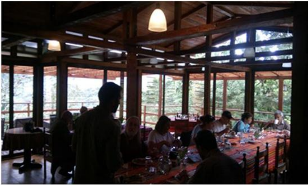
Figura 34. Turistas en el restaurante.

Las Cabañas San Isidro genera remuneraciones alrededor de $5000 dólares mensuales por los 10 trabajadores fijos que emplea, sin tomar en cuenta los trabajos ocasionales nombrados anteriormente. En propinas que dejan los huéspedes, oscila un promedio de $50 dólares mensuales para cada empleado y el proporcional del 10% de servicios que se cobra al turista a través de la facturación, alcanza un promedio de $12.000 anuales, cantidad que se distribuye entre los empleados.