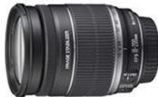
Figura 23. Lente 18-200.

-Facilita en la toma de pájaros a lo lejos por la dificultad de que estos no se acercan fácilmente al ser humano.