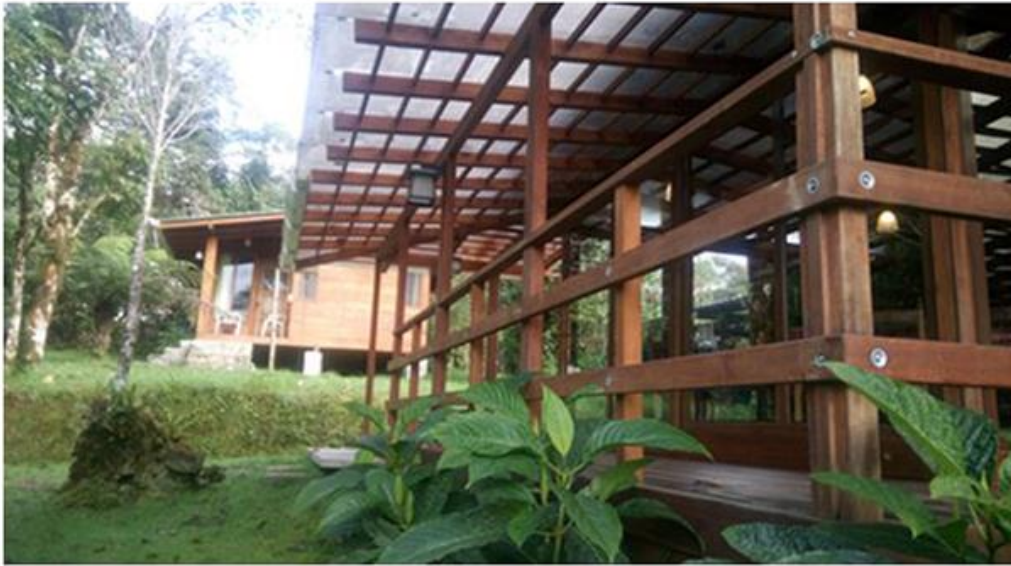
Figura 13. Mirador de Cabañas San Isidro con fondo de habitación.

Entre las actividades que ha colaborado el proyecto de San Isidro son las investigaciones y estudios que han sido realizados en su área por Yanayacu Biological Station, estos han sido reconocidos internacionalmente. Algunos de estos estudios son: