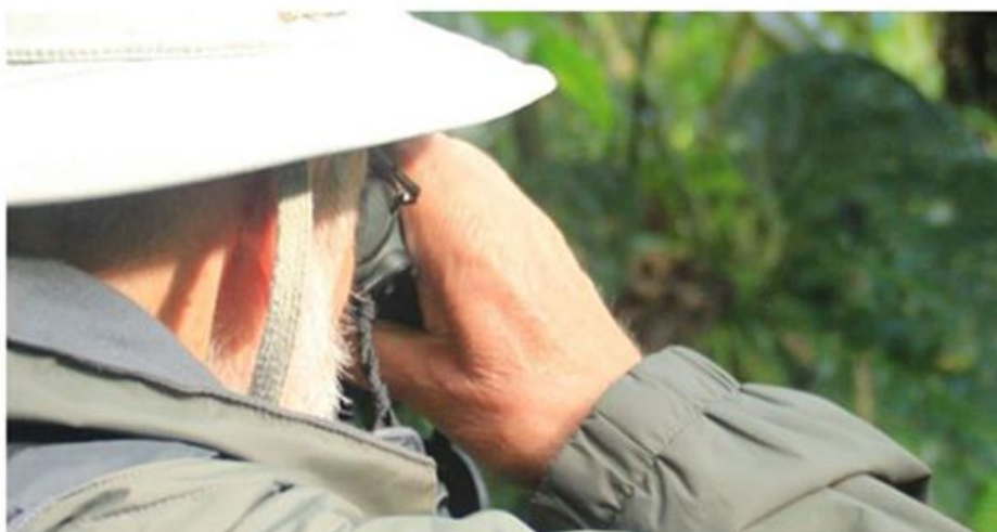
Figura 3. El birdwatcher.

Es una persona de estrato económico medio alto y alto y de nivel educativo alto. Es un empresario, un doctor, abogado o actor de cine, también varios presidentes y primeras damas; embajadores entre otros, participan en este pasatiempo y más mujeres que hombres. (Mindo Cloudforest Foundation, Greenfield, Rodriguez, Krohnke, Campbell, 2006, p.4)