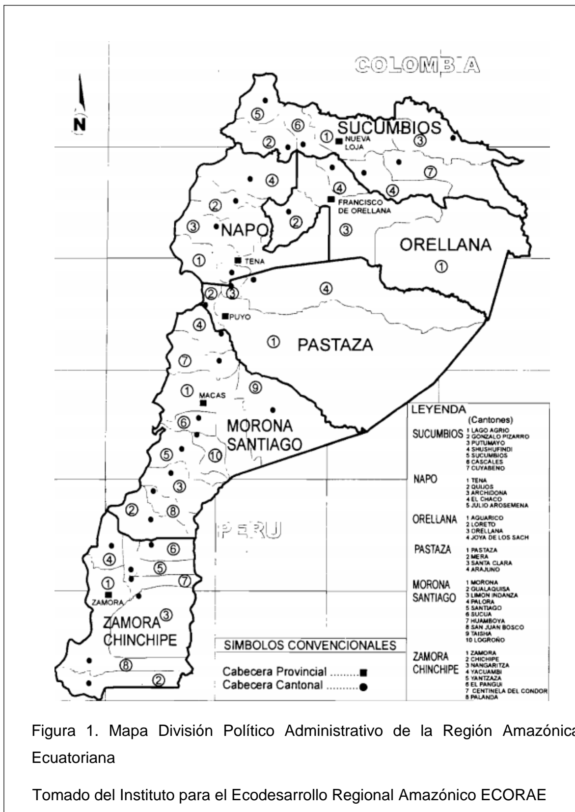
Figura 1. Mapa División Político Administrativo de la Región Amazónica Ecuatoriana