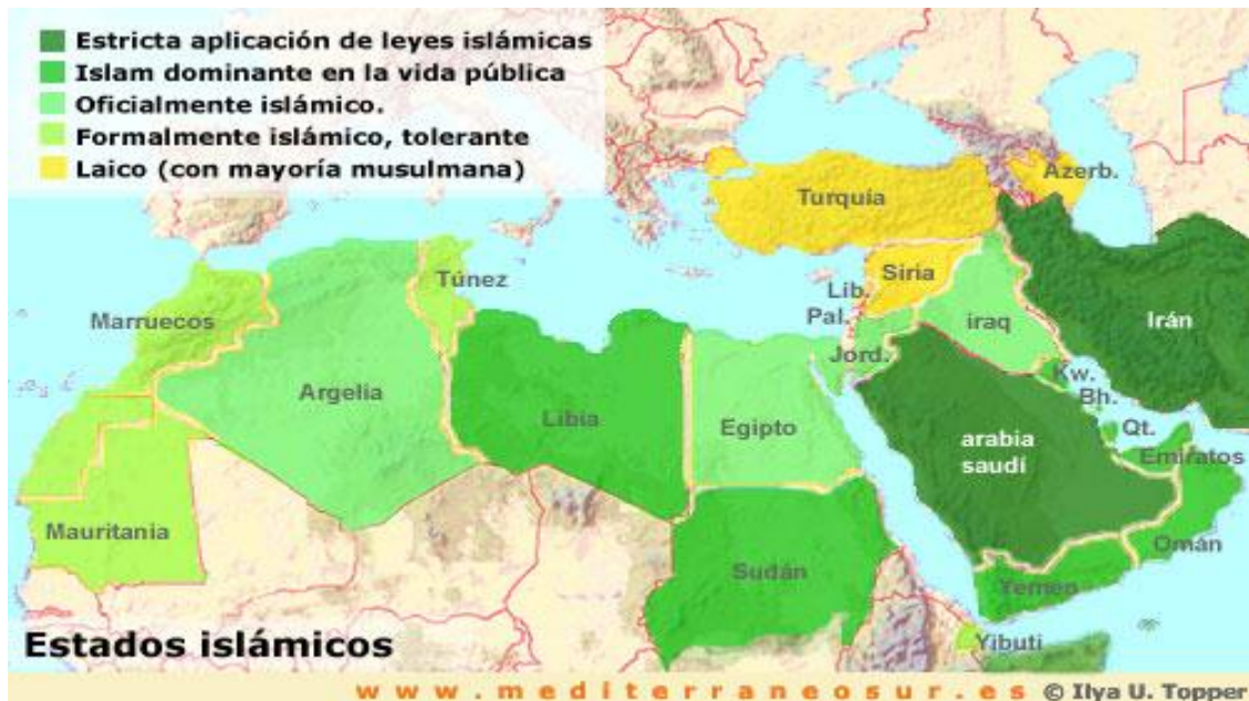
Figura 2. Países en donde la Sharia se encuentra establecida.