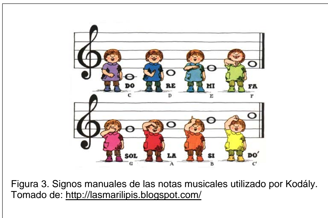
Figura 3. Signos manuales de las notas musicales utilizado por Kodály. Tomado de: http://lasmarilipis.blogspot.com/

Con estas bases se deben realizar juegos musicales y enseñar canciones a los niños, para que posteriormente ellos puedan adquirir conocimientos sobre el ritmo, notas musicales, compases, etc. Un elemento importante y que caracteriza esta metodología es la utilización de la fonomimia, son signos manuales que expresan la altura de las notas, para que los infantes puedan reconocer y cantar en tono apropiado las notas a simple vista. Los signos son los que se muestran a continuación.