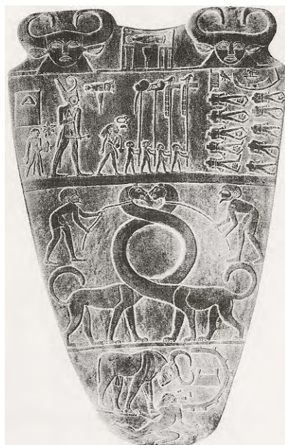
Ilustración 5. Revés de la paleta del Rey Nar-Mer.