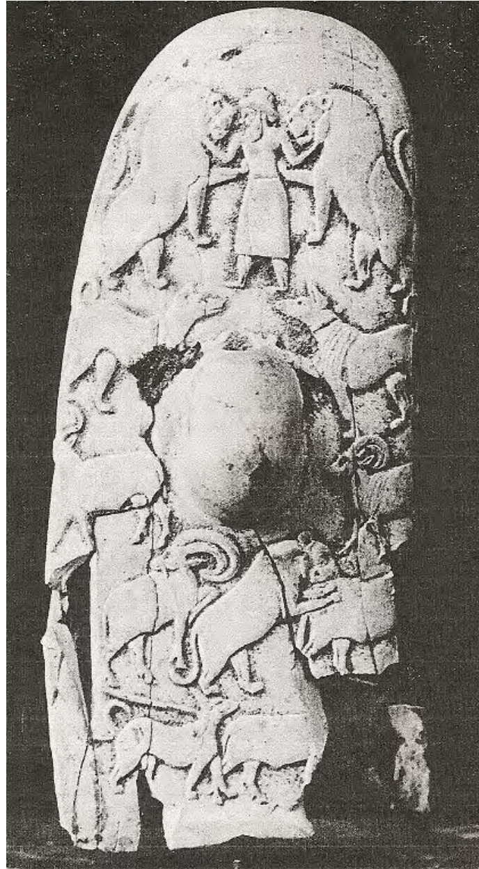
Ilustración 2. Hombre con vestimenta sumeria o semítica.