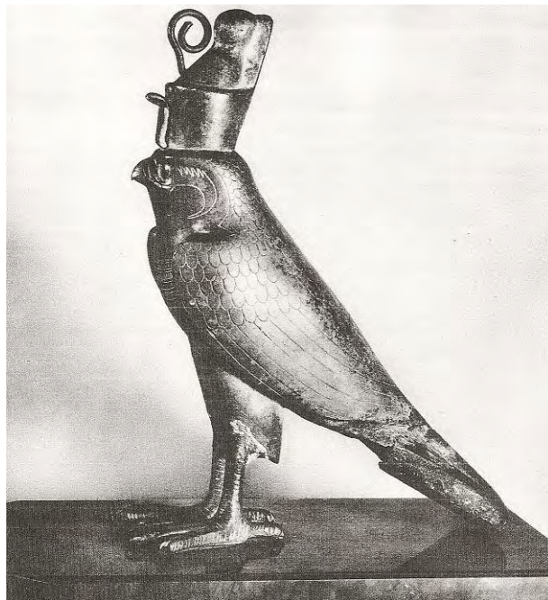
Ilustración 24. Figurilla en bronce del Dios Horus, bajo forma de halcón.