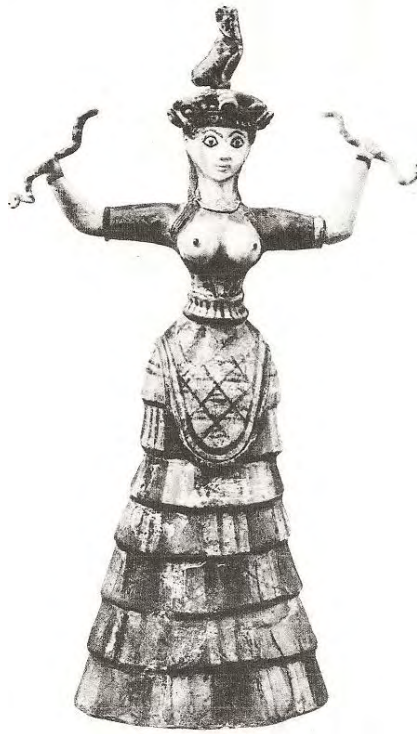
Ilustración 14. Figura de la Diosa de las Serpientes.