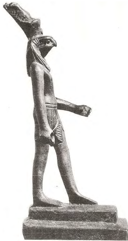
Ilustración 23. El Dios Halcón Horus, con cuerpo humano.