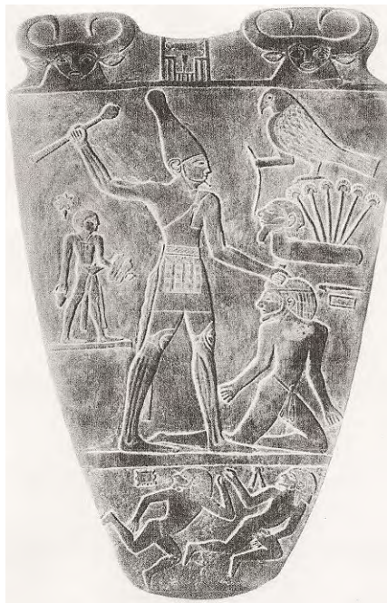
Ilustración 4. El Rey Nar-Mer hiriendo a un prisionero.