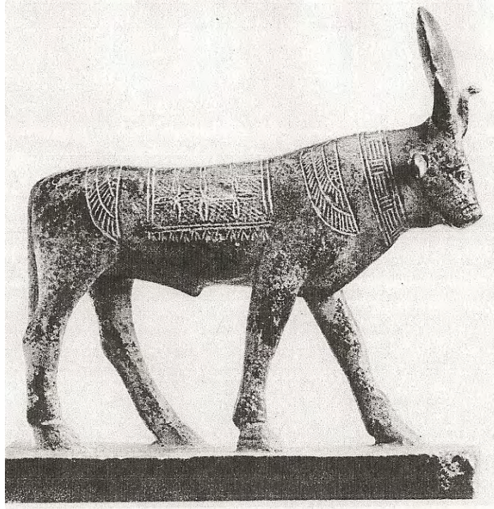
Ilustración 84. Apis, llevando un disco entre sus cuernos y un Uraeus.