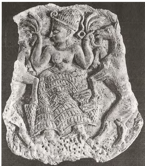
Ilustración 39. Potnia Theron. La señora de las fieras.