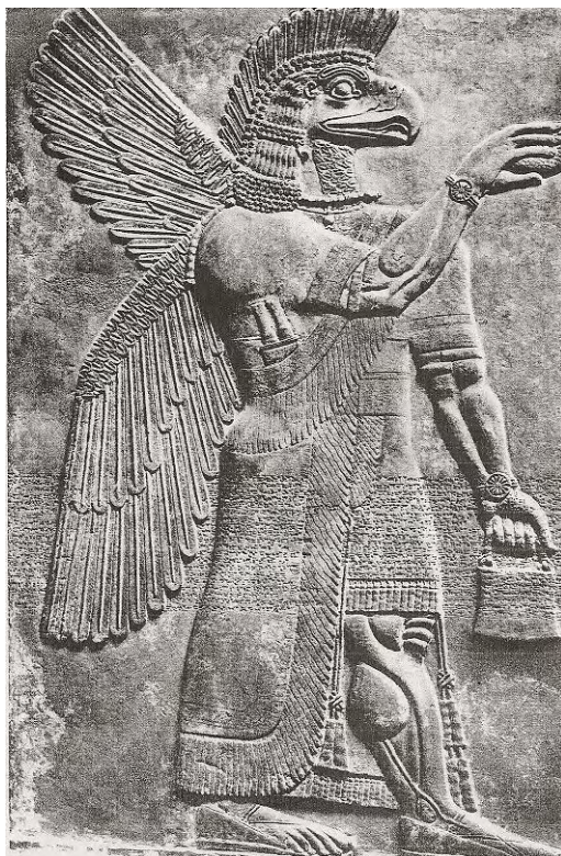
Ilustración 31. El Dios Ashur de Asiria