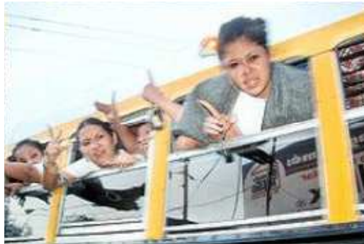
Gráfico 5. Jóvenes empleando señales características de una pandilla.