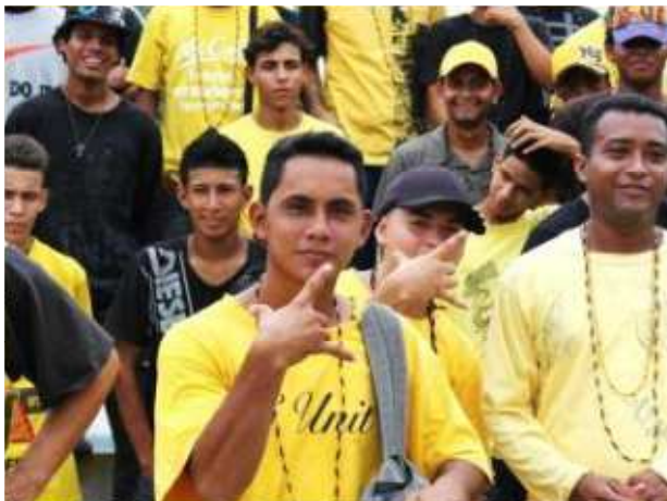
Gráfico 7. Integrantes de Latin Kings en Durán – Ecuador