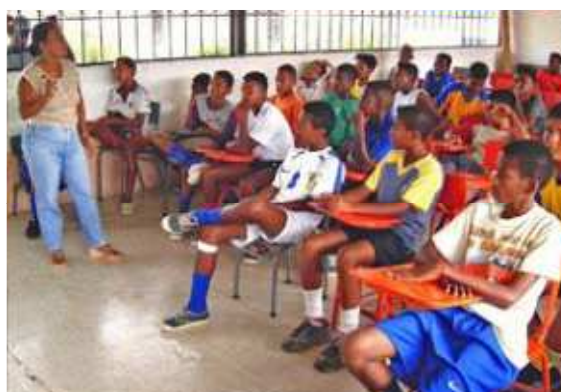
Gráfico 10. Estudiantes del Proyecto Educativo de Fundación Amiga, Unidad Educativa “San Daniel Comboni”.

Trabajar el diseño de metodologías de estudio-deporte que permita aprovechar principalmente las potencialidades deportivas de estudiantes provenientes de los barrios más vulnerables.