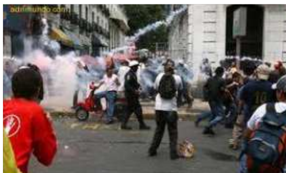
Gráfico 4. Jóvenes estudiantes en protesta estudiantil.

Las manchas escolares: están conformadas por los alumnos de los colegios que se enfrentan, ocasionalmente, en las principales avenidas de su distrito. En Quito los estudiantes de los colegios Mejía y Montúfar, en Guayaquil el Vicente Rocafuerte y Aguirre Abad y en Esmeraldas el 5 de Agosto y Luis Tello.