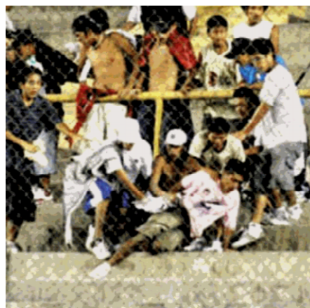
Gráfico 3. Las características “Barras Bravas” en actos vandálicos.

En países como Argentina y Brasil ocurre igual entre hinchas de Boca Juniors y River Plate, Flamengo y Fluminense respectivamente.