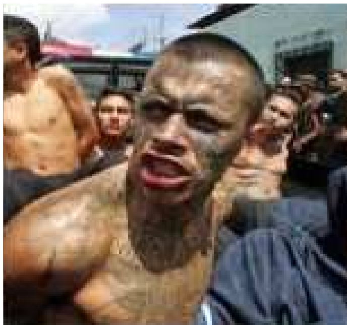
Gráfico 6. Integrantes de los “Mara Salvatrucha” detenidos por policías.

La pertenencia a estas organizaciones también está sujeta a cuotas mensuales de dinero, destinadas a la organización de fiestas, grafitis y compra de armas; ejemplo de ellos son Latin King y los Mara Salvatrucha.