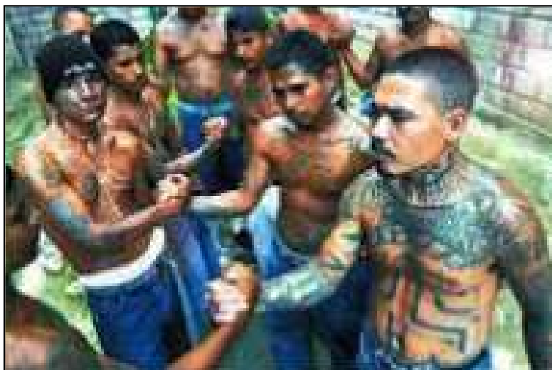
Gráfico 1. Integrantes de la pandilla salvadoreña “Mara Salvatrucha” con tatuajes característicos.