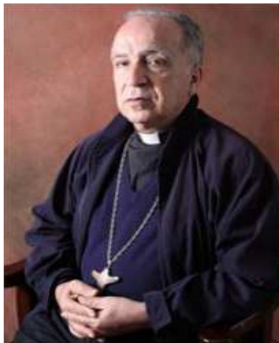
Gráfico 8: Obispo Vicario Apostólico De Esmeraldas