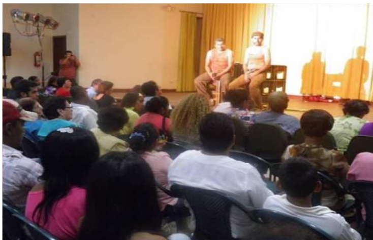
Gráfico 11. Presentación de jóvenes en la Casa de la cultura Esmeraldas, donde se promueve cultura a través del teatro.

El break dance, conciertos, ferias de paz, teatro y el arte urbano.