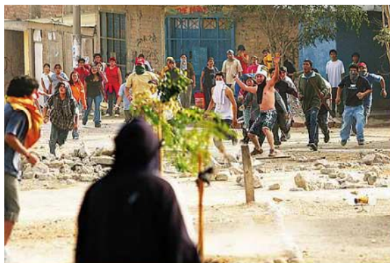
Gráfico 2. Disputas protagonizadas por “Pandillas de Barrio”