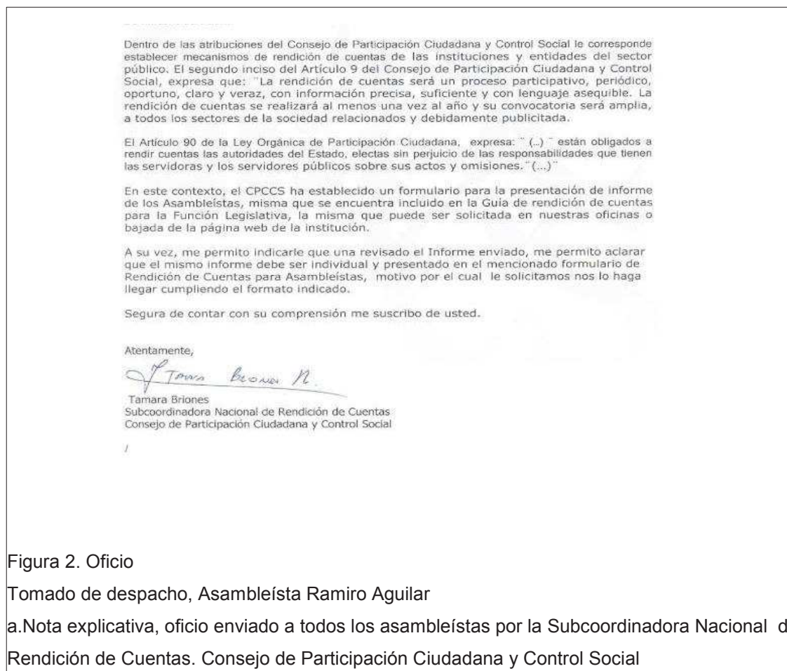
Figura 2. Oficio

Así, el CPCCS se encarga de recordarles a los asambleístas, mediante un oficio sobre la obligación que tienen de rendir cuentas por su año de gestión.