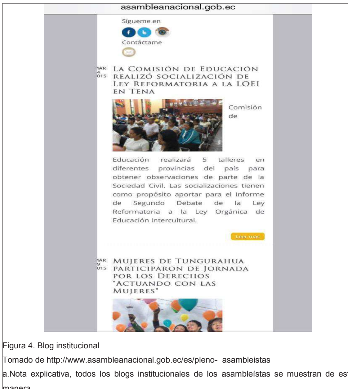
Figura 4. Blog institucional

Tomado de http://www.asambleanacional.gob.ec/es/pleno-asambleistas