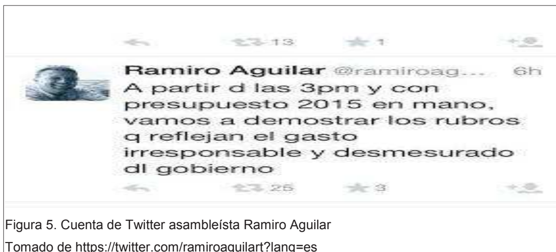
Figura 5. Cuenta de Twitter asambleísta Ramiro Aguilar