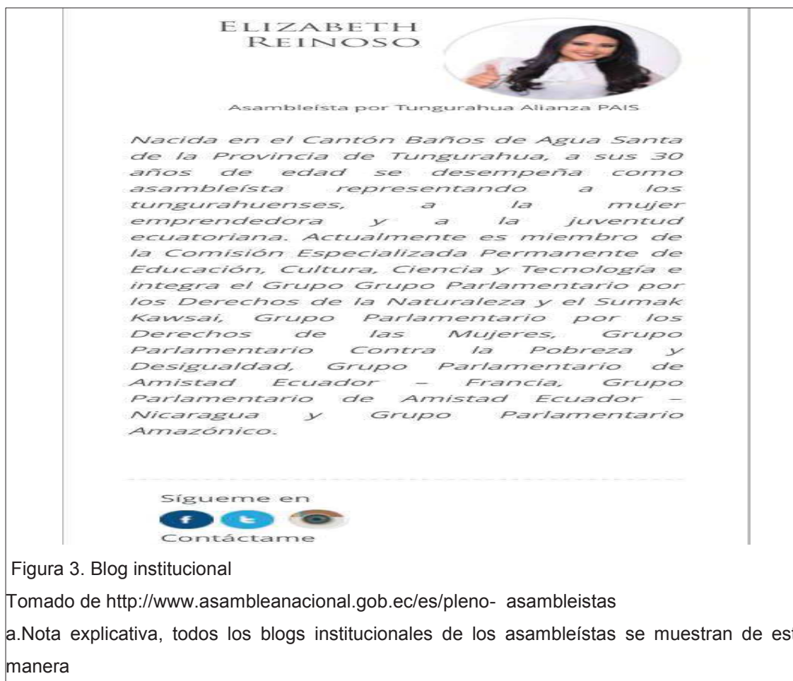
Figura 3. Blog institucional