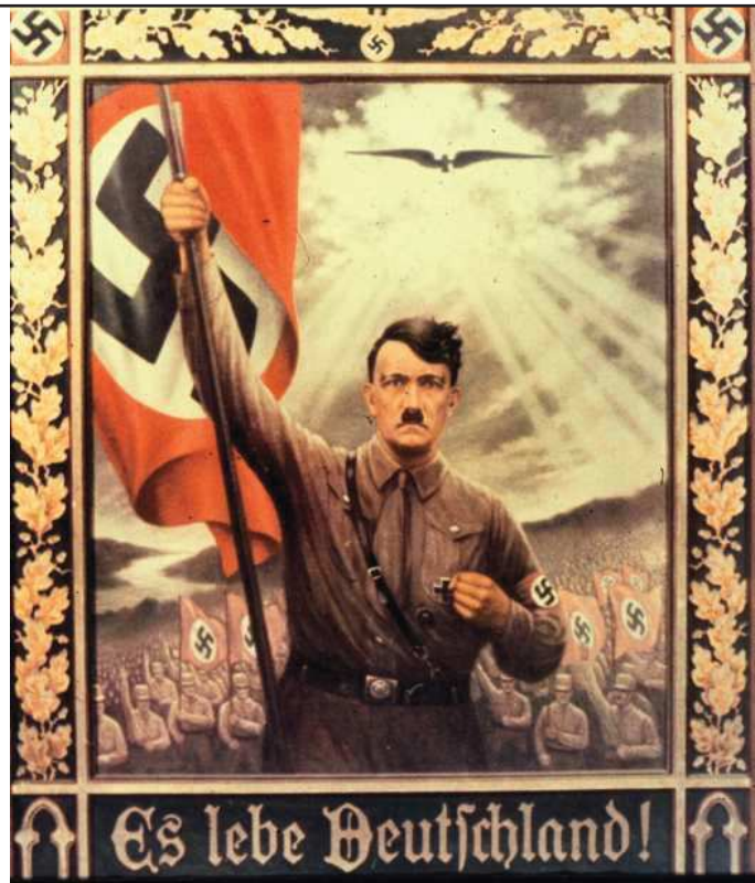
Figura 1. ¡Viva Alemania!