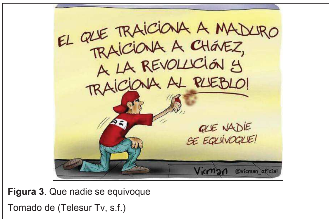
Figura 3. Que nadie se equivoque