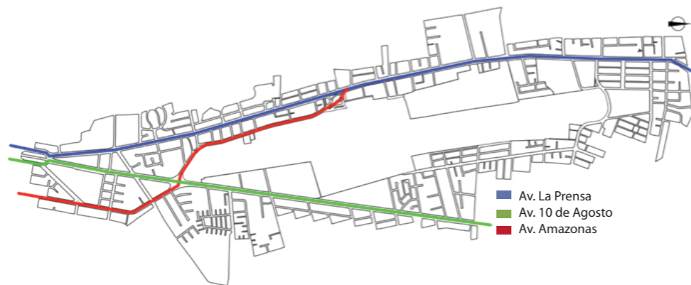
Figura 13. Mapa del aeropuerto sentido Sur-Norte.