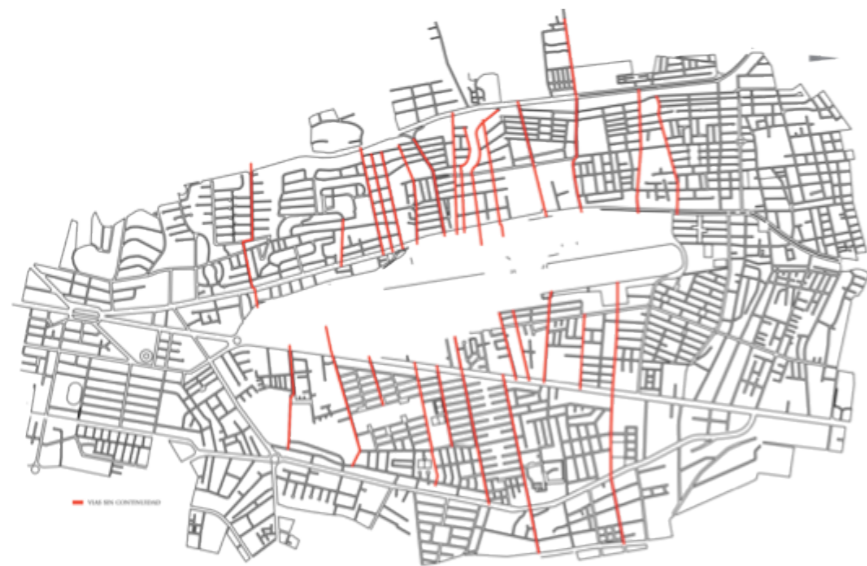
Figura 12. Mapa del aeropuerto sentido Este-Oeste.