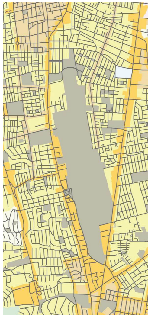
Figura 21. Plan de uso y ocupación de suelo (2005)