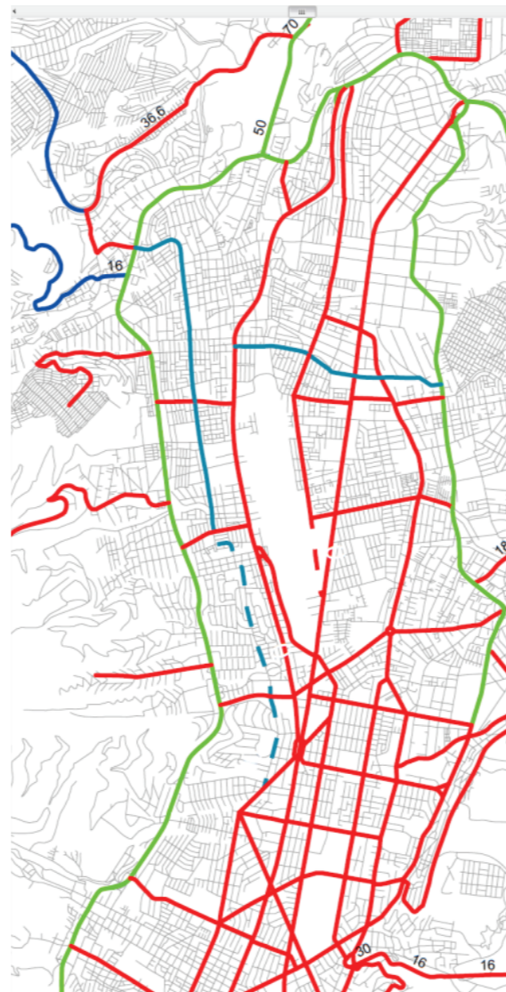
Figura 22. Dimensionamiento vial.