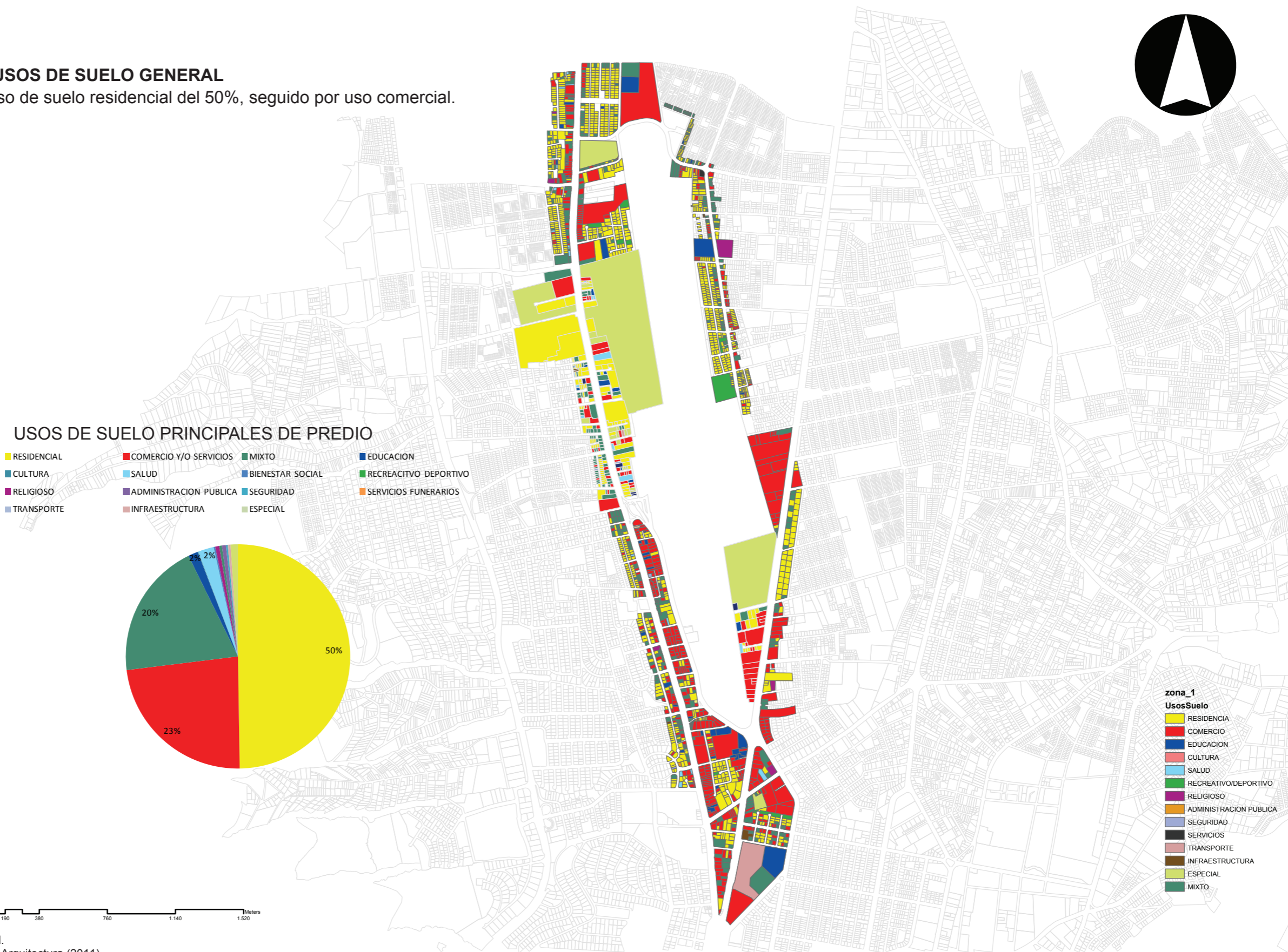
Figura 16. Usos de suelo general.

Uso de suelo residencial del 50%, seguido por uso comercial.