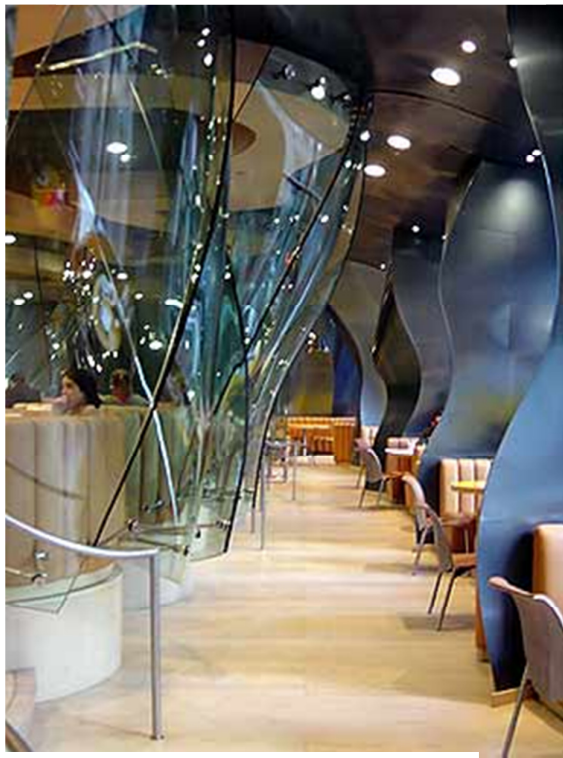
Grafico 4.6 Hall de circulación

Architectural design Cafes, Bars & Restaurants; autor: Arian Mostaed.