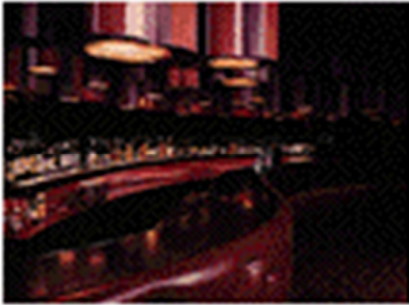
Gráfico 3.1 barra