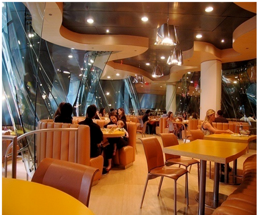
Gráfico 4.3 Zona de mesas

Arquitectural design Cafes, Bars & Restaurants; autor: Arian Mostaed