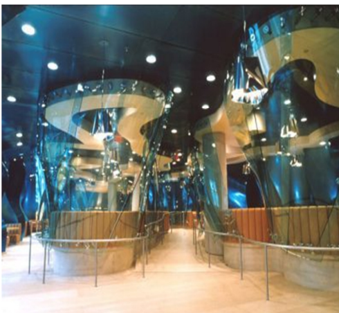
Grafico 4.5 Hall de circulación

El diseño es atractivo, imponente y diferente, emite movimiento gracias a la armonía que tienen sus paneles transparentes, los mismos que ayudan a encontrar un punto medio entre privacidad y contacto-comunicación, con el resto de usuarios presentes.