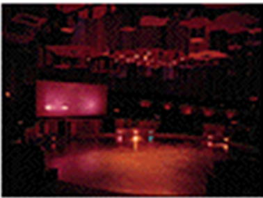
Gráfico 3.2 pista de baile