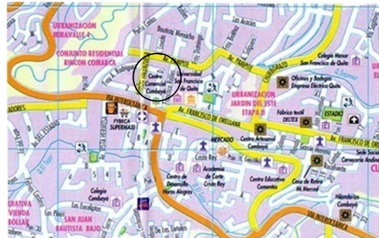
Gráfico 4.17 Plano arquitectónico