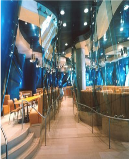
Grafico 4.4 Hall de circulación

Las cabinas adicionales están situadas en una plataforma que se levanta dentro de paneles de cristal curvados en el centro del área de mesas principal. El piso del es un chapeado, y el techo esta revestido en los paneles de titanio azules que complementan las paredes del perímetro. El servidor, que está adyacente al área que comedor principal, es una facilidad totalmente equipada que proporciona una selección de diversas entradas calientes y frías.