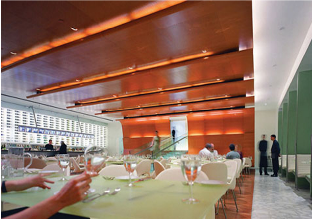
Arquitectural design Cafes, Bars & Restaurants; autor: Arian Mostaed

(5) Arquitectural design Cafes, Bars & Restaurants