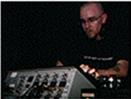
Gráfico 3.4 Richie Hawtin

En 1993 se desplaza al rock a un segundo término. y llegan los disc.-jockeys. El primer dj invitado causó sensación entre el público, también hizo saltar todos los altavoces.