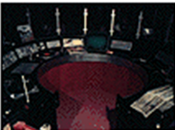
Gráfico 3.3 cabina DJ