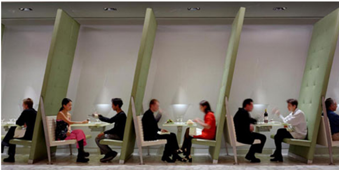
Arquitectural design Cafes, Bars & Restaurants; autor: Arian Mostaed

En el comedor posterior, un muro de cristal de 14,6m., de longitud se apoya contra el muro perimetral y protege una serie de motivos decorativos.