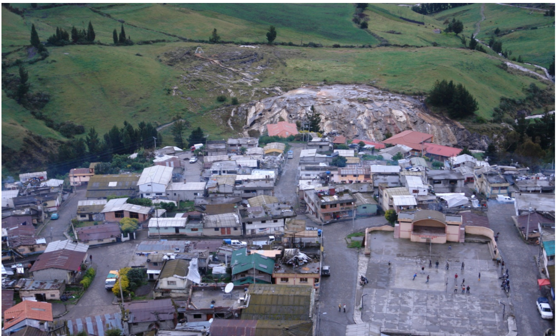
Vista de la comunidad de microempresarios desde la montaña