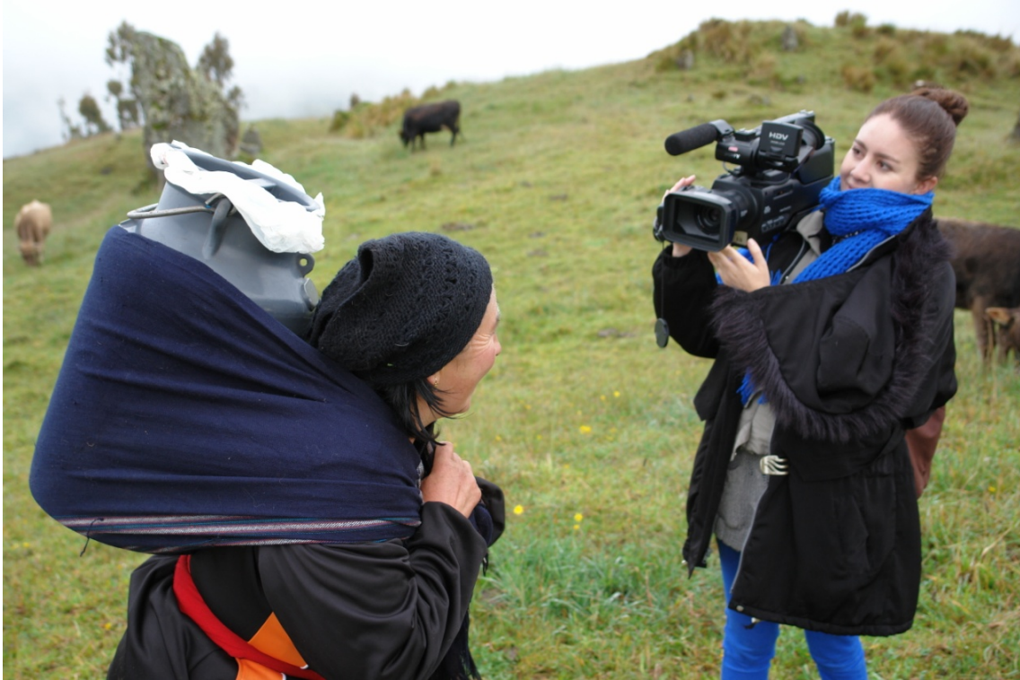
El trabajo de la mujer salinera y su experiencia con los medios