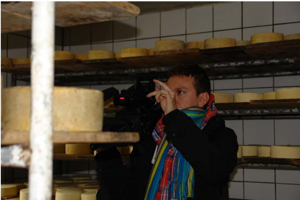
En la labor periodística en las queseras "El Salinerito"