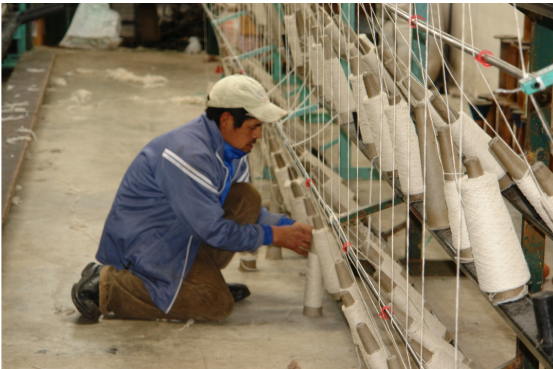
Las actividades productivas constituyen el sustento diario de las familias