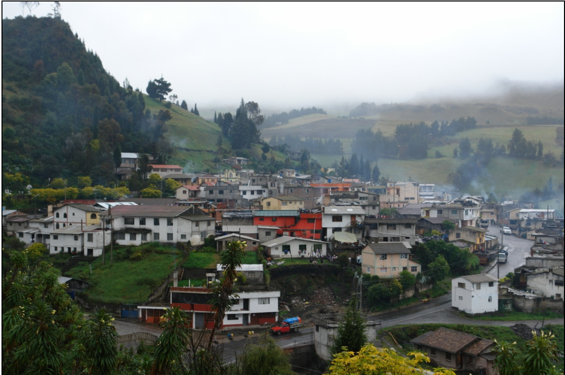
Plano General de Salinas de Guaranda