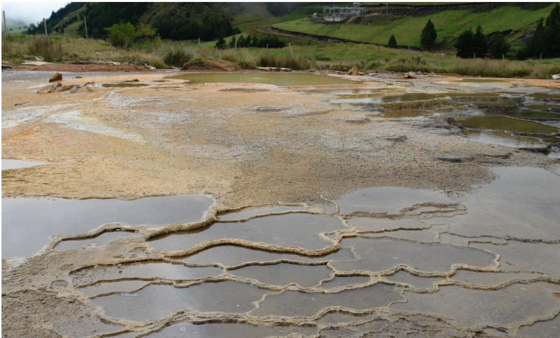
Hace 40 años la comunidad vivía solamente de la extracción de las minas de sal