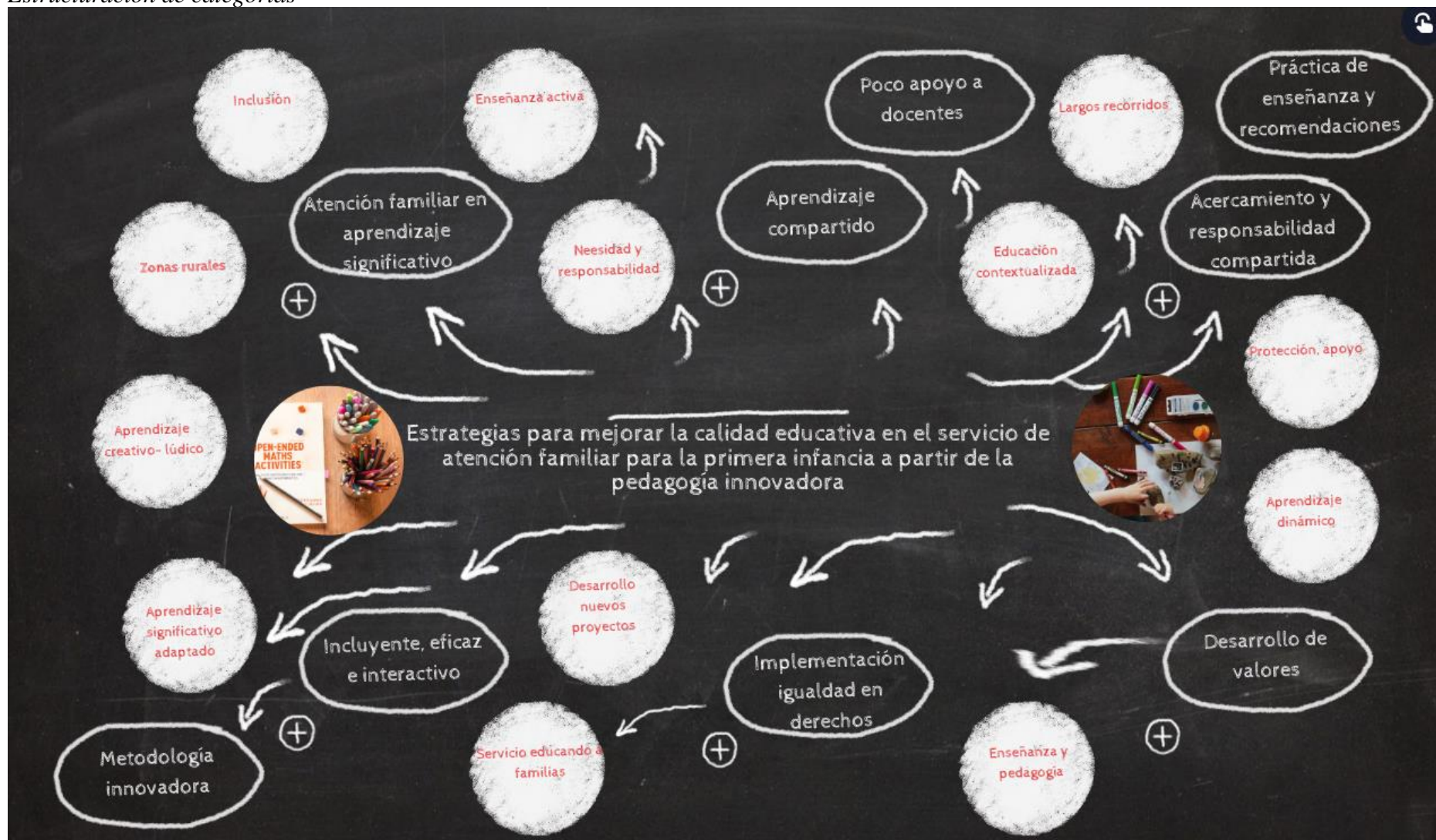
Figura 2 Estructuración de categorías