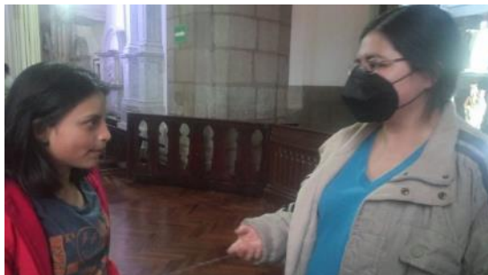
Entrevista a Integrantes Jóvenes