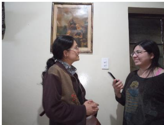
Entrevista a Maestra