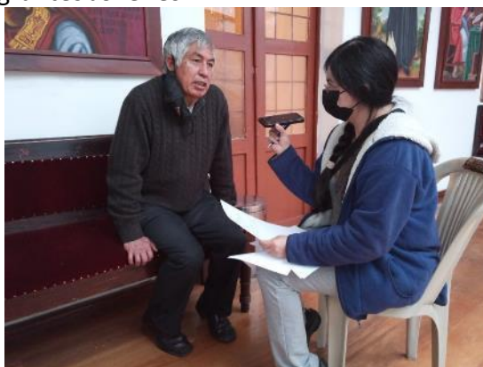
Entrevista a Adultos Mayores