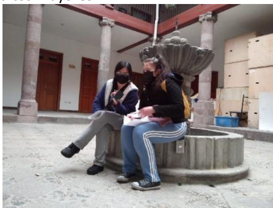
Entrevista a Padres de Familia