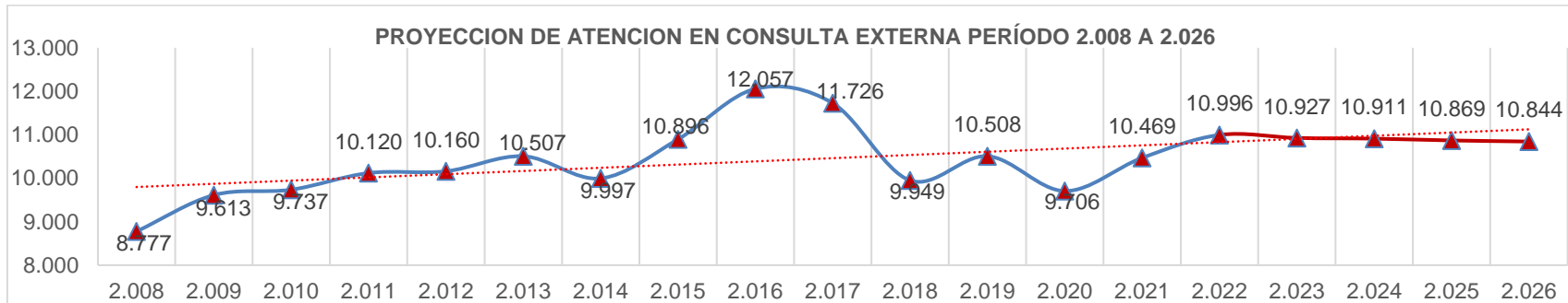
Figura 4 Cuadro proyección atención consulta externa

Nota: Fuente: Estadísticas Solca Núcleo de Quito 2008 - 2026