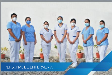
PERSONAL DE ENFERMERIA