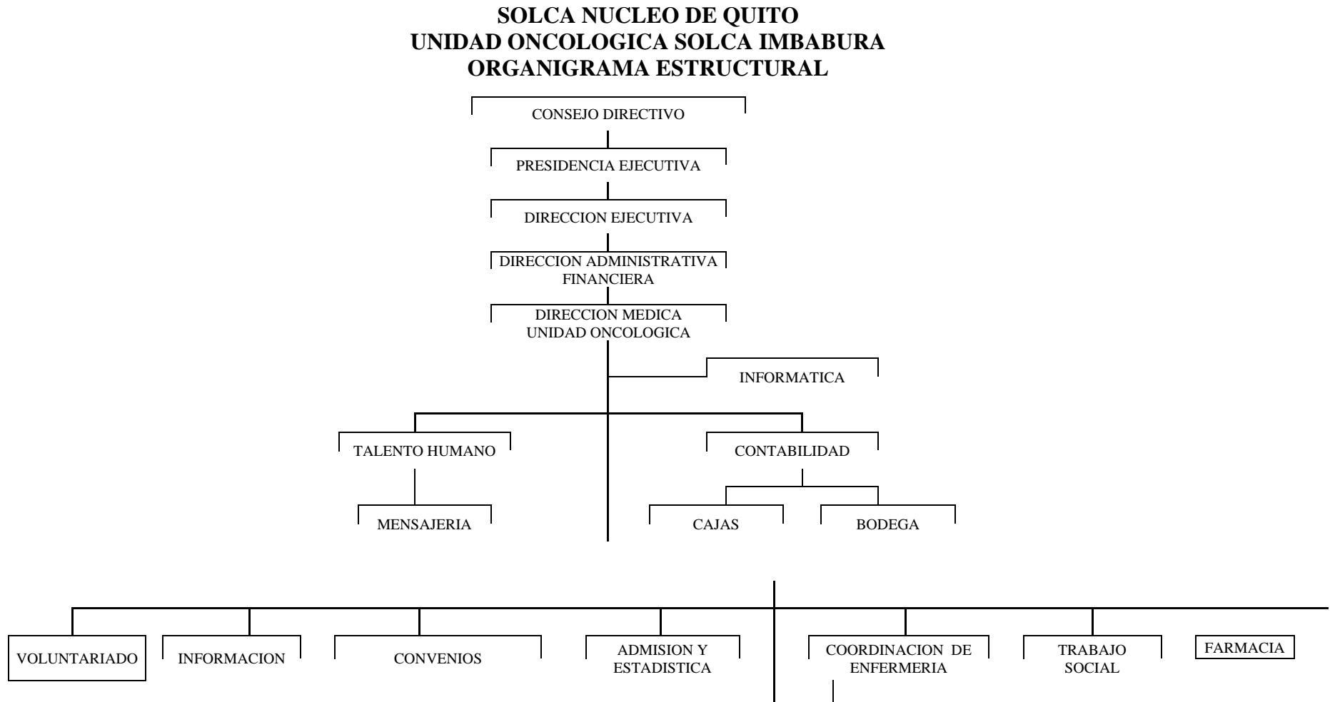
Figura 1 Organigrama Estructural