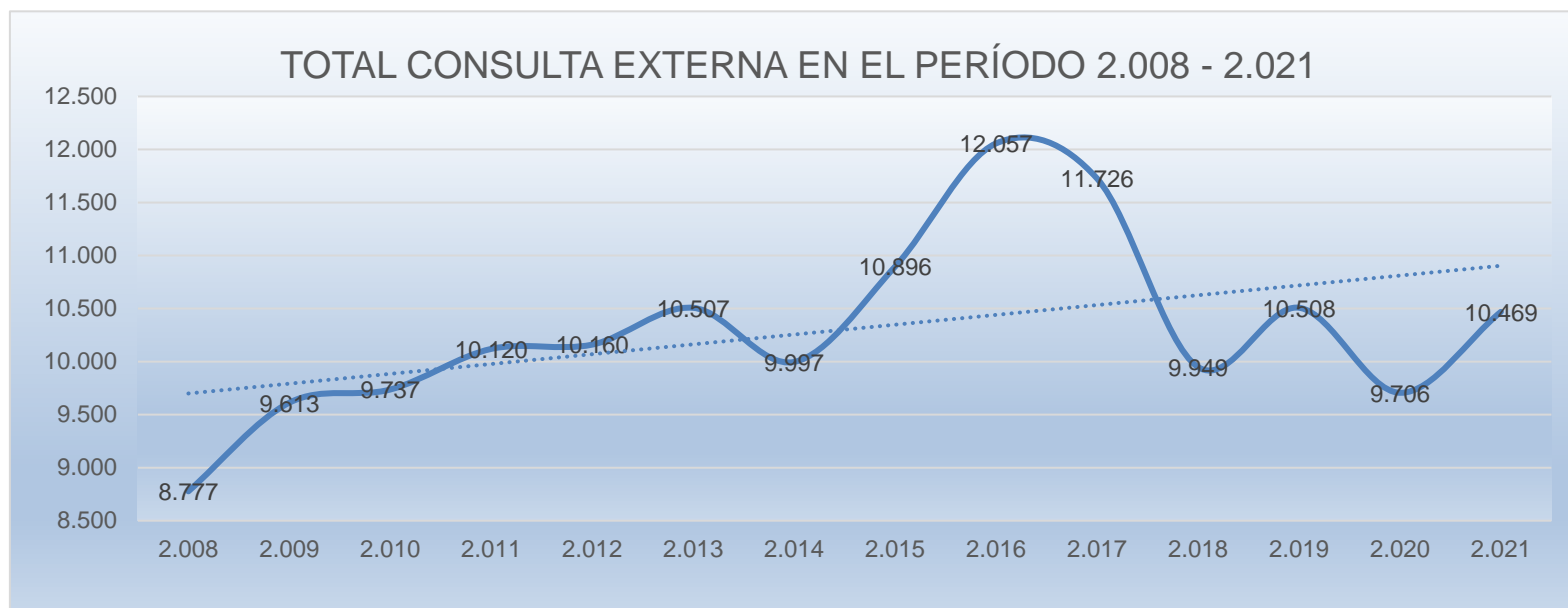
Figura 2 Consulta Externa periodo 2008 -2021

Fuentes: Estadísticas Solca Núcleo de Quito 2008 - 2021