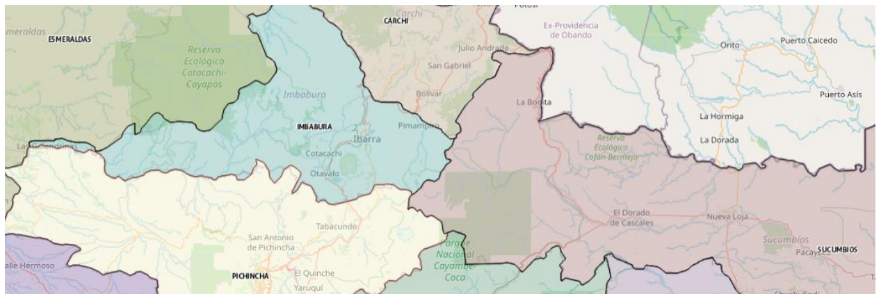
Figura 3 Mapa Zona norte país

Solca Imbabura brinda atención a pacientes de las provincias aledañas, Carchi, Esmeraldas, parte de la provincia de Sucumbíos, y por su área de influencia norte de Pichincha (Cayambe - Tabacundo).