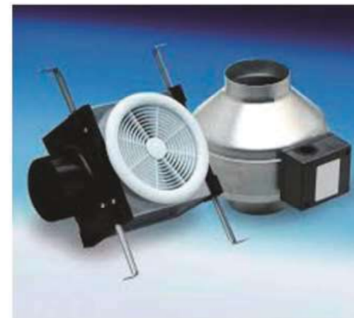
Extractor de Baño Premium - Difusor Doble