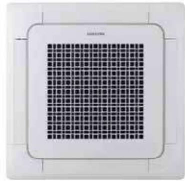
COMPRESOR DE 48000 BTU/h

Tipo: 4 WAY CASSETTE Modelo: AM048FN4DCH/AA DVM, casete de 4 vía, R410a de bomba de calor, unidad para interiores