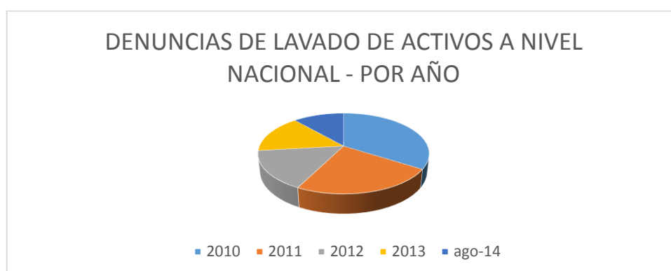
Tabla No.4 Denuncias de lavado de activos a nivel nacional

Tomado de: "Perfil Criminológico" de la Fiscalía General del Estado