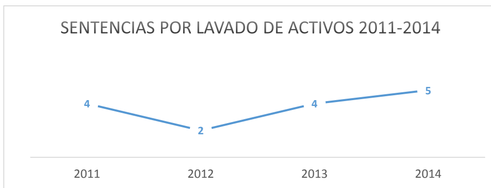
Tabla No.5 Sentencias por lavado de activos 2011-2014

Tomado de: "Perfil Criminológico" de la Fiscalía General del Estado