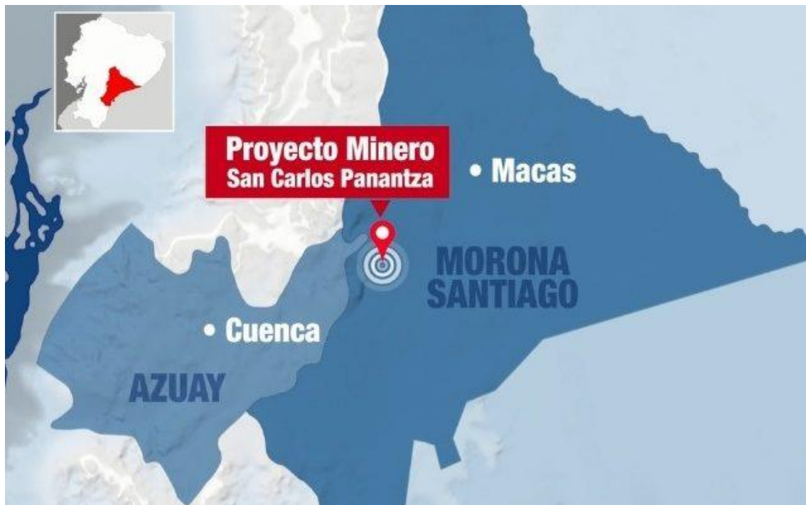
Figura 2: Proyecto minero San Carlos Panantza