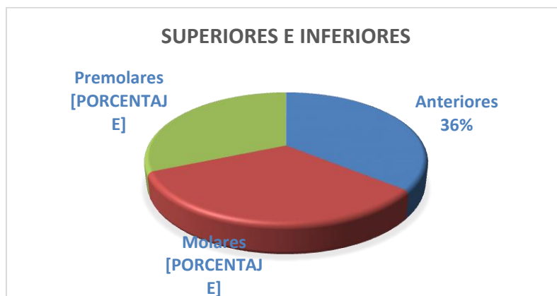
Figura 2. Grupo Dentales

Pudiendo observar también que los dientes anteriores superiores e inferiores, son los más tratados con algún tipo de alargamiento de corona con 24 casos, seguido por los molares con 22 casos y luego con 21 casos el grupo de los premolares. (Figura 2)