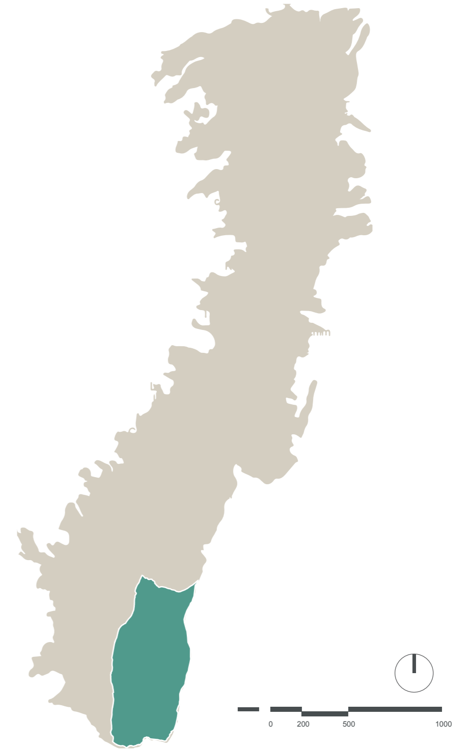
Figura 1. Ubicación Adaptado de (Pou, 2014, p. 4).

● ZONA DE ESTUDIO: TURUBAMBA, SUR DE QUITO SUPERFICIE: 2,056 HA.