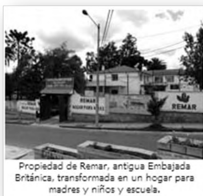
Propiedad de Remar, antigua Embajada Británica, transformada en un hogar para madres y niños y escuela.

Tiene en funcionamiento seis hogares de acogida para hombres alcohólicos o drogadictos donde participan en programas de rehabilitación y reinserción social.