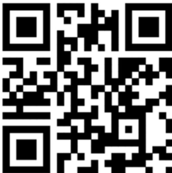
Figura 4. Código QR