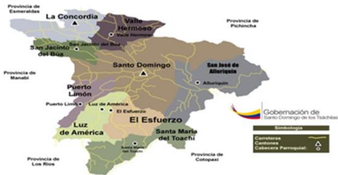
Figura 1. Mapa geográfico Santo Domingo de los Tsáchilas