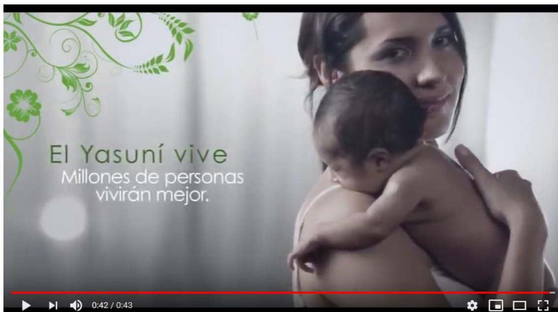
Figura 1. El Yasuní vive