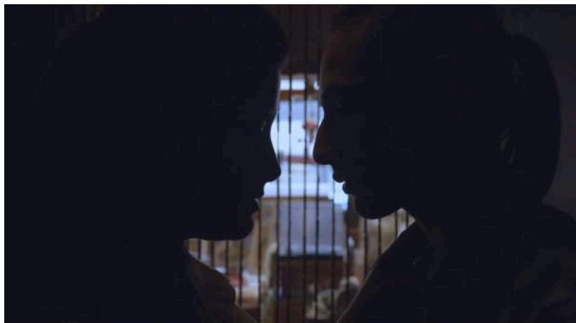
Figura 4.

Tras comprender que el conflicto de los personajes nace de un sentimiento puro, la estética cinematográfica apoya este fundamento trabajando la intimidad entre ellos. Los movimientos de cámara los acompañan siempre muy de cerca, mostrándonos el contacto entre ellos y cómo dejan fuera todo su entorno; hasta que llega Alejandra y empieza a distanciarlos. Los sonidos son ambientales en su mayoría y están presentes canciones de artistas como Lucio Battisti y el grupo "Los Iracundos", los cuales mantienen contrastes en sus composiciones ya que mientras la letra denota fatalidad, el ritmo es opuesto y es movido, lo que genera una ambigüedad; así como lo que están viviendo los personajes, entre el deseo y la condición. Los colores son fríos y se encuentran en un ambiente ligeramente azulado ya que permite profundizar en los sentimientos agobiantes por los que están pasando.