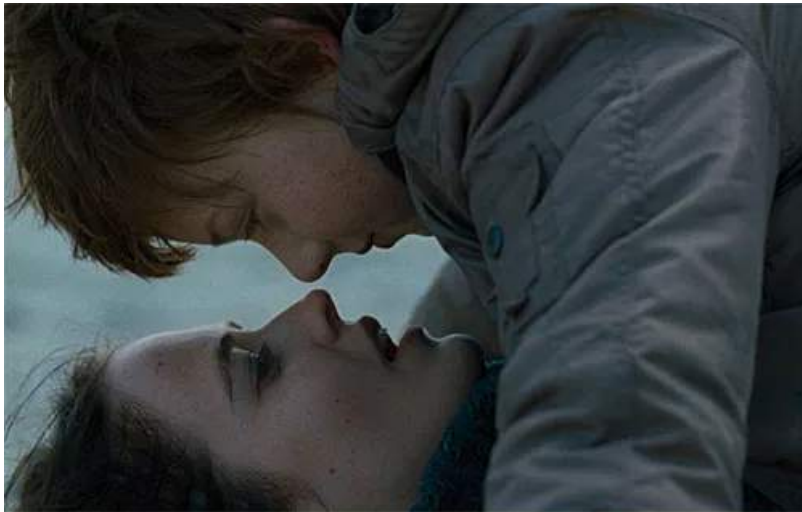
Figura 4. Tomado de: Womb (Fliegau, 2010)

azulados, siempre transmitiéndonos un toque de inocencia pero que es interrumpida por esta atracción mutua indeseable.