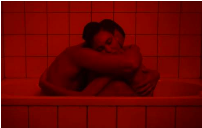
Figura 2. Tomado de: Love (Noé, 2015)

Todos estos elementos fueron abordados desde la dirección cinematográfica para generar sensaciones coherentes entre cada uno de ellos. Sin embargo, para una crítica superflua la película quedó siendo la acumulación de escenas escandalosas de desnudos, en otras palabras pornografía que no debería ser vista.