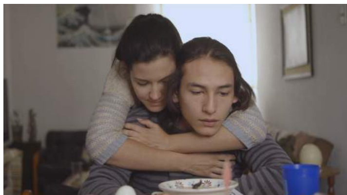
Figura 4. Tomado de: Detrás de la puerta (Pilco, 2020)

Tras el análisis de estos referentes se puede estudiar el caso del cortometraje "Detrás de la puerta" (Pilco, 2020) que surge como parte de esta investigación. En este proyecto audiovisual se trabajó desde la recopilación de todos los detalles que representan al tabú en la sociedad, y cómo en el cine pueden ser interpretadas desde la dirección cinematográfica.