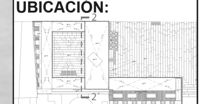
LÁMINA: ARQ - 23