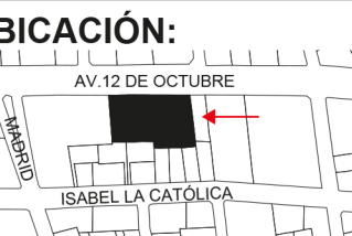
LÁMINA: ARQ - 22