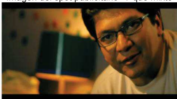
Imagen del spot publicitario “Y qué mixto”