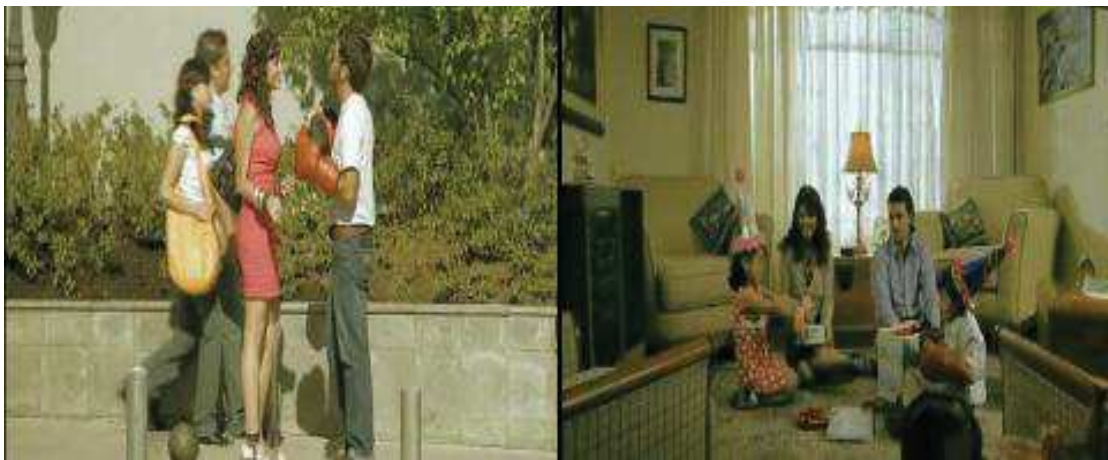
Imagen del spot publicitario “Guantes”