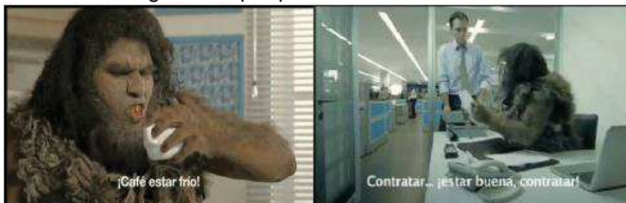
Imagen del spot publicitario “Cavernícola”