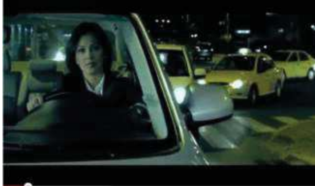
Imagen del spot publicitario “Y qué mixto”