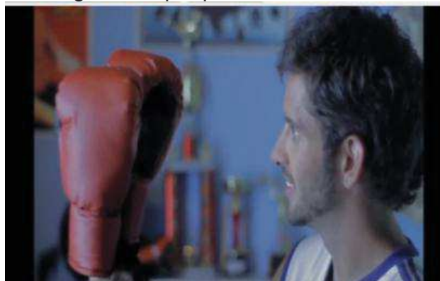
Imagen del spot publicitario “Guantes”