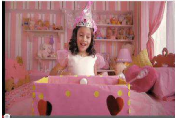
Imagen del spot publicitario “Guantes”