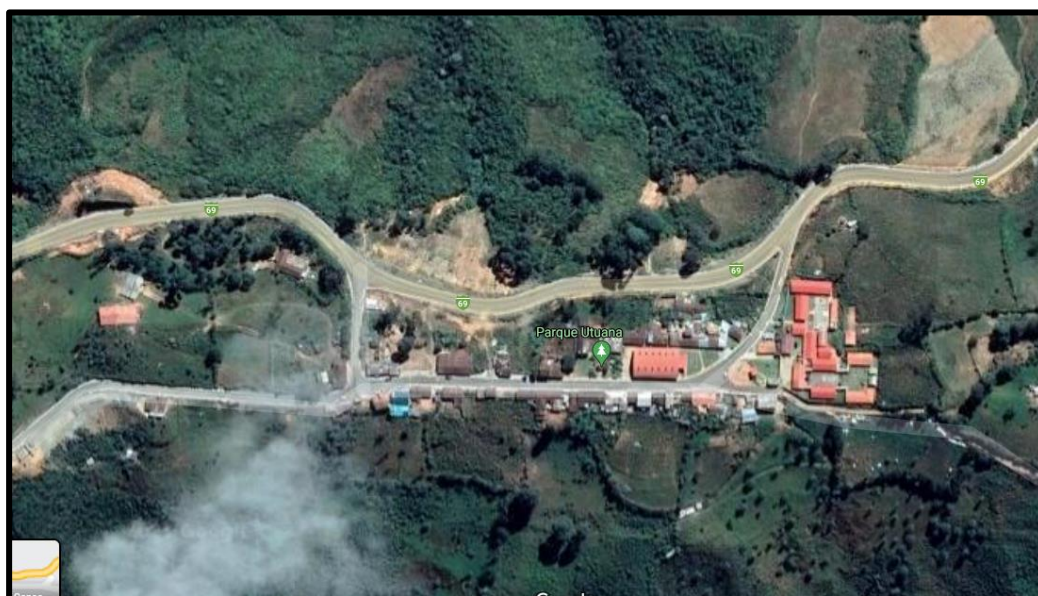
Figura 1. Mapa satelital de la Parroquia Utuana.

El Dispensario Utuana del Seguro Social Campesino, ubicado en la parroquia Utuana, perteneciente al cantón Calvas, provincia de Loja, se encuentra al sur oriente del cantón a una distancia de 31 km aproximadamente de la ciudad de Cariamanga, cabecera cantonal de Calvas. Los núcleos urbanos más importantes de población situados más cerca son: Cariamanga y Sozoranga.