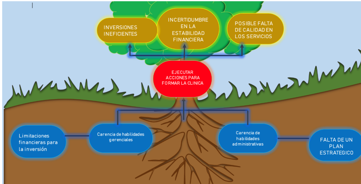
Ilustración 2: Acciones para formar clínica

técnica que se requiere para administrarla de manera eficiente.