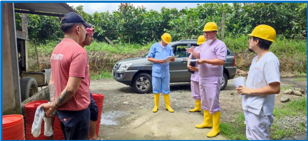
Imagen 2. Encuesta de campo a trabajadores Granja 1