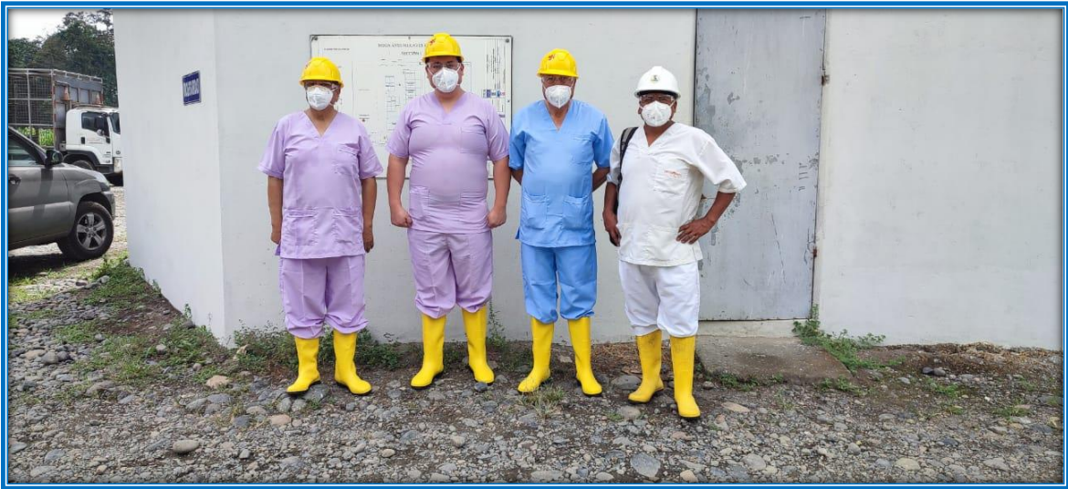
Imagen 1. Técnicos y médicos de salud ocupacional empresa Mega aves