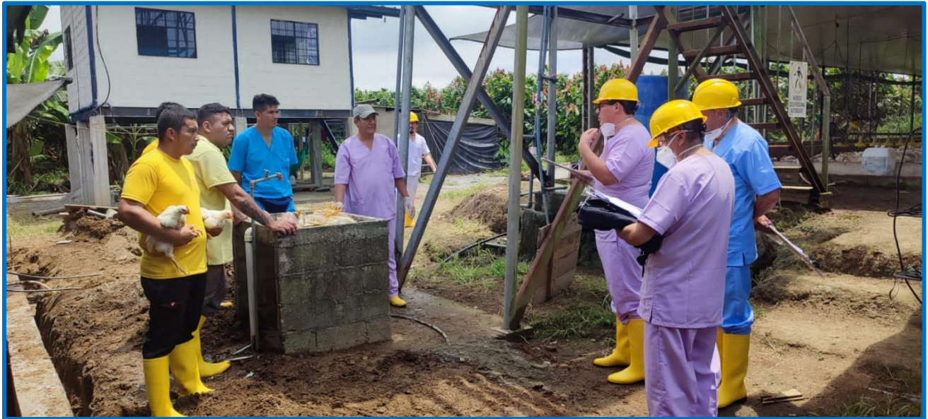
Imagen 4. Encuesta de campo a trabajadores Granja 3