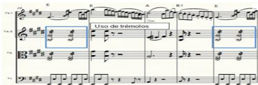
Figura 25. Uso de trémolos. Adaptada de Kistner, 2012.