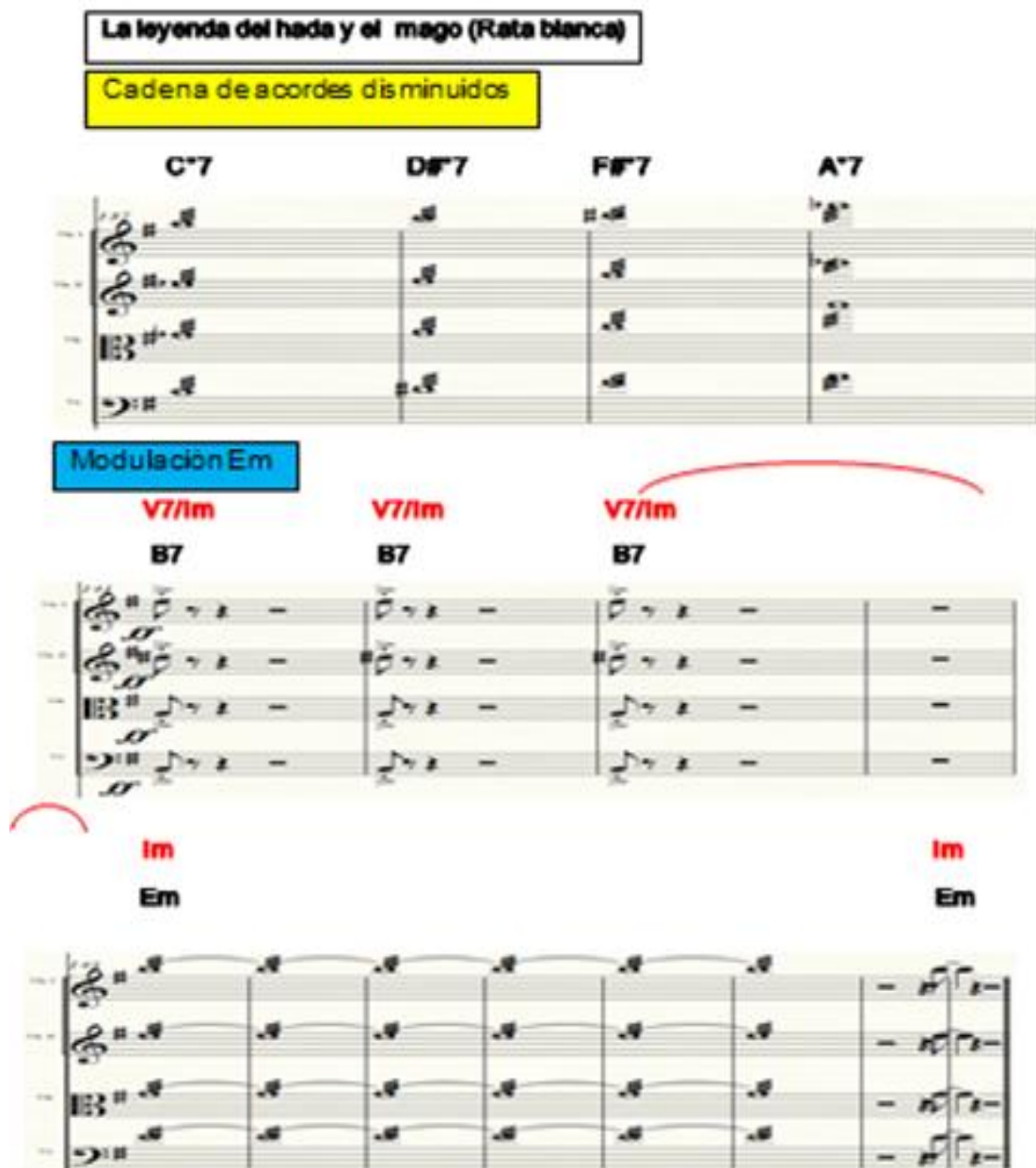
Figura 41. Sección (E). Comparación de un fragmento de la progresión armónica de la obra de Niccolò Paganini con la progresión armónica replicada en la adaptación del tema La leyenda del hada y el mago .

Para finalizar, en la figura 41 se utiliza una cadena de disminuidos para generar tensión y enriquecer la resolución del acorde B7 que funciona como dominante secundario del acorde Em para resolver en el mismo como primer grado menor de la tonalidad original del tema La leyenda del hada y el mago .