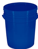
Figura 2: Envase Caneca