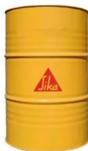
Figura 7: Tambor de aditivo