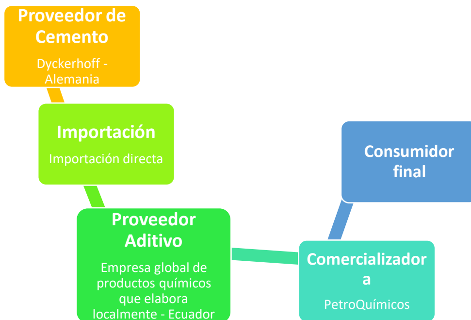
Figura 5: Canal de distribución-Cadena de suministro