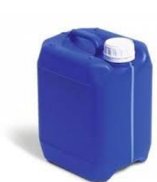
Figura 1: Envase Balde

El empaque de los dos productos va por separado. El cemento Dyckerhoff será vendido en sacos de 25kg, este usará el mismo de importación. El aditivo nacional se puede vender en distintas presentaciones dependiendo la compra de este, pueden ser: garrafón, cuñete y tambores.