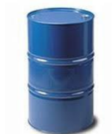
Figura 3: Envase Tambor