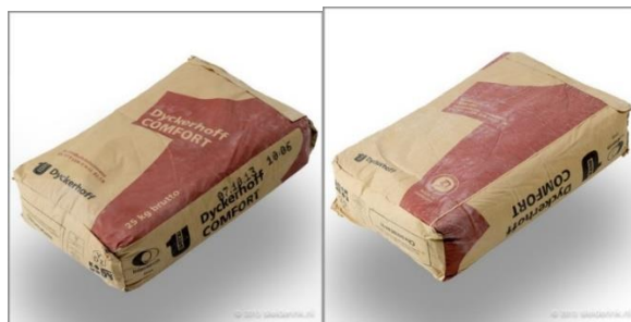
Figura 6: Saco de Cemento

Al realizar los trámites de importación, si la mercancía no cumple con los requisitos para importación de una persona normal, se deberá realizar con un agente de aduana para el registro de importación y nacionalización de la carga.