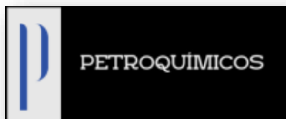
Figura 4: Logo de empresa

Estos colores tratarán de transmitir el concepto de una empresa que busca ser reconocida por situar un producto nacional en una industria que se inclina por mercancía extranjera.